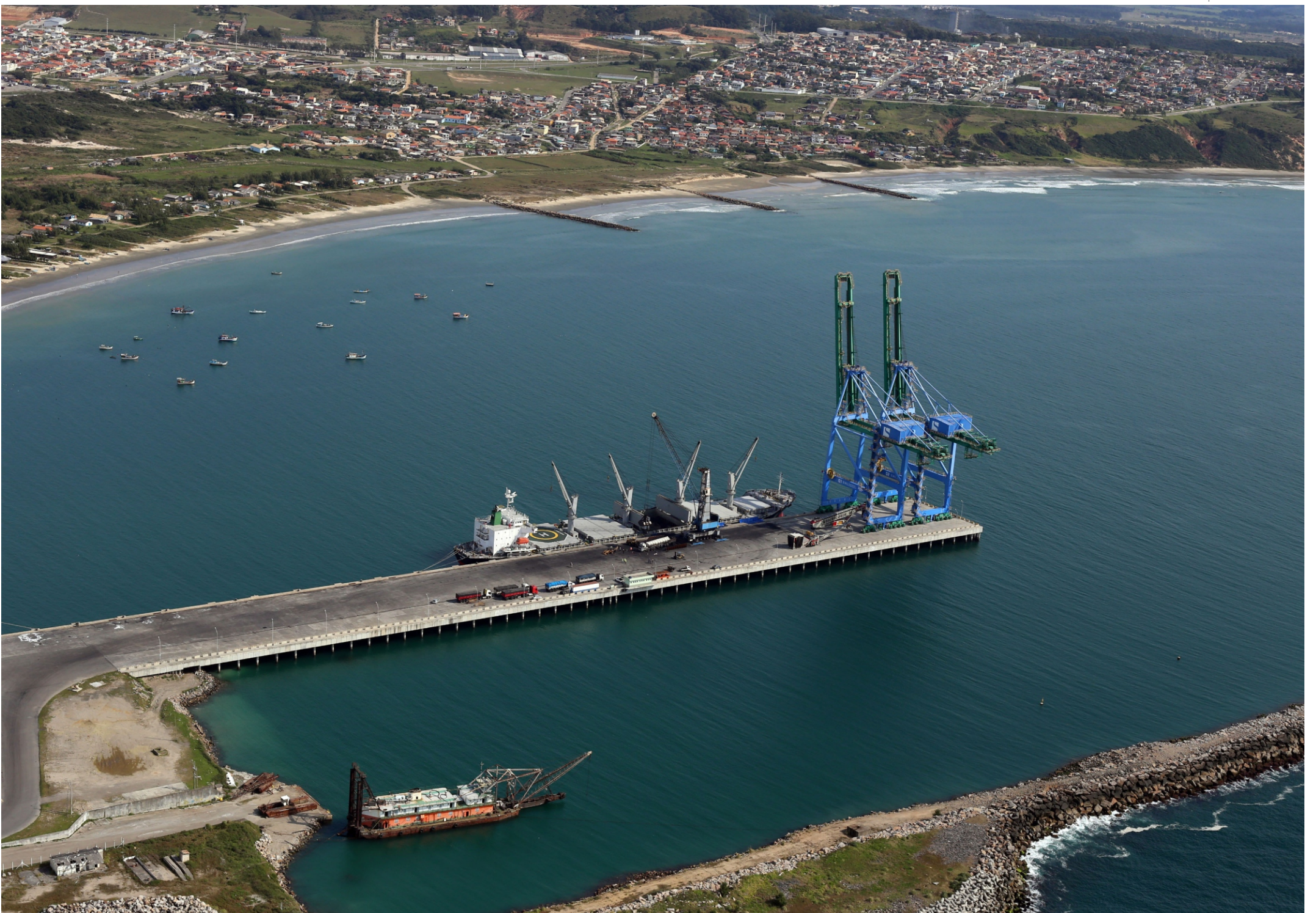
▲ Porto de Imbituba movimentou mais de 717 mil toneladas de cargas em abril, superando o volume de março, que foi de 537, 1 mil toneladas

BÁRBARA FARIAS barbara@portalbenews.com.br