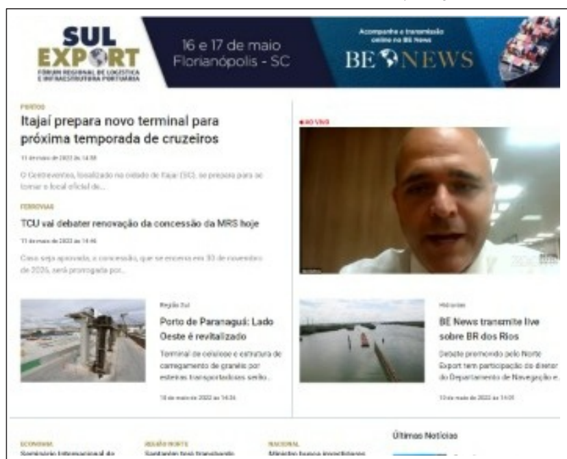
▲ Debate sobre hidrovias e a BR dos Rios foi transmitida ao vivo pelo Portal BE News