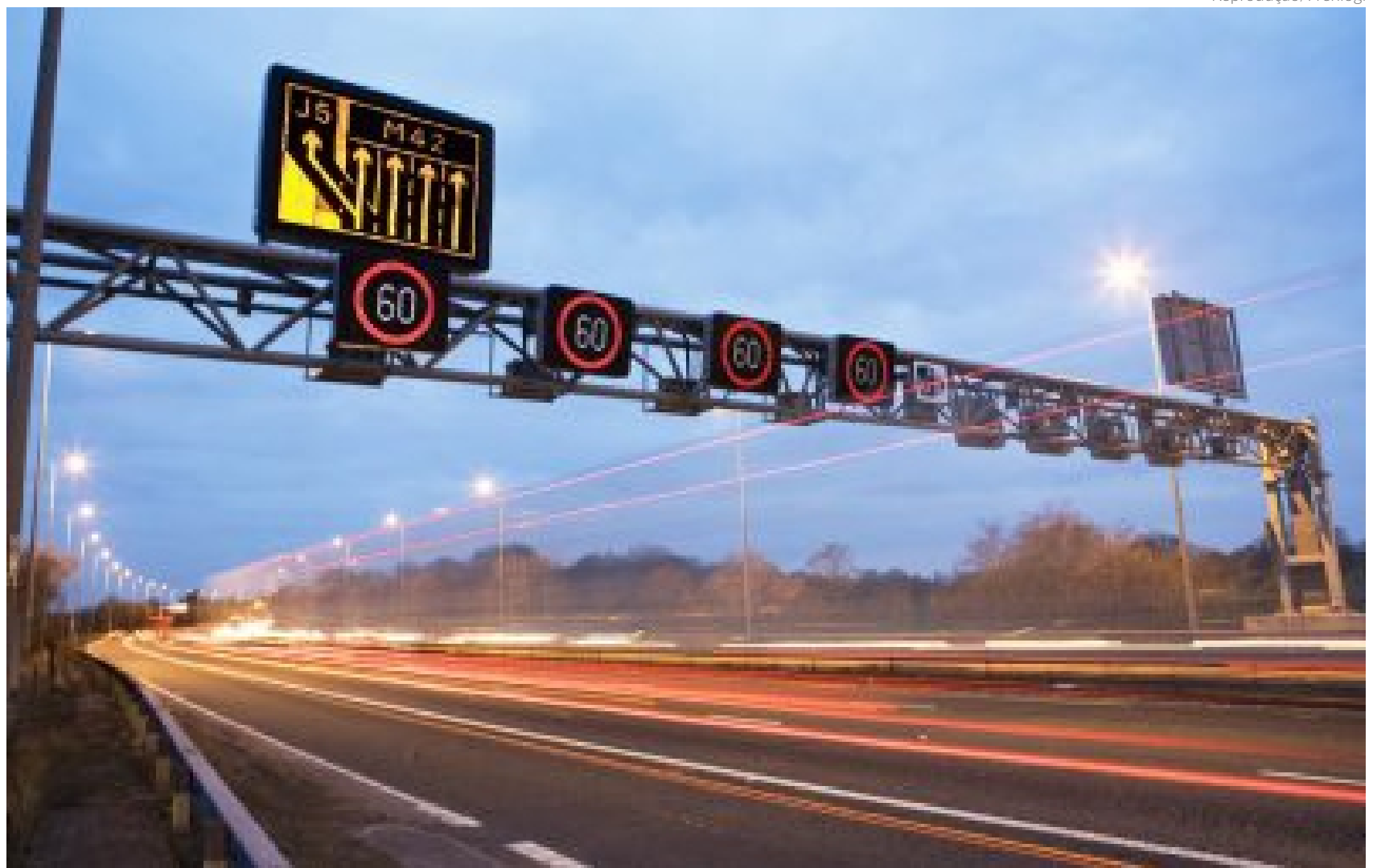
O pedágio free flow é um sistema de livre passagem sem praças de cobrança e pagamento de acordo com a quantidade de quilômetros rodados

TALES SILVEIRA tales@portalbenews.com.br