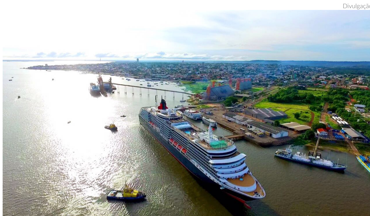
O Porto de Santarém se destacou em 2022 ao conseguir, em março, ser o quarto maior porto exportador de soja do Brasil, e no mês de julho, o segundo maior exportador de milho