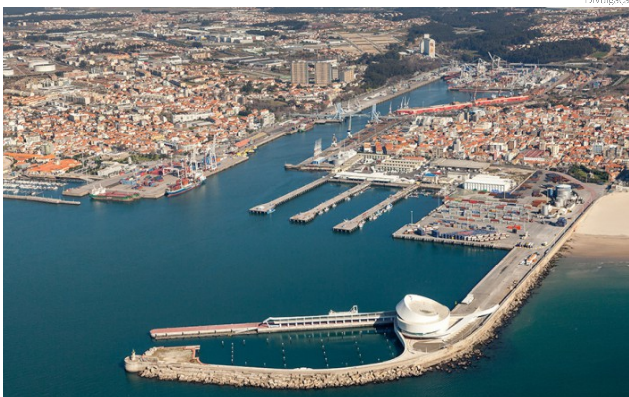
Para a APDL, a certificação “demonstra o compromisso do Porto de Leixões com a qualidade e a segurança nas operações realizadas”

A norma ISO 28000 tem como objetivo estabelecer, implementar e melhorar os níveis de segurança e proteção nas operações; melhorar as condições de segurança na cadeia logística; garantir as competências necessárias para o desempenho das funções operacionais; assegurar a conformidade com a política de segurança estabelecida e demonstrar essa