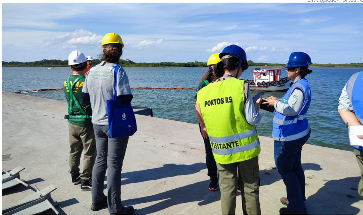
O trabalho foi realizado por uma equipe multiprofissional, composta por analistas ambientais, vindos de Brasília e Porto Alegre, além do Rio Grande