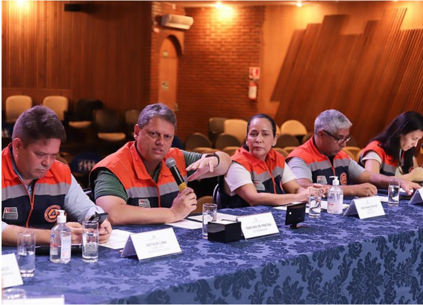
Tarcísio de Freitas prometeu novas maneiras de emitir alertas para áreas de risco no Litoral Norte paulista em coletiva de imprensa realizada ontem

“Agente viu que isso, eventualmente, não tem maior efetividade. Aqui para o litoral mais de 30 mil pessoas receberam o SMS de alerta, então a gente precisa ter uma maneira mais efetiva”, ressaltou o governador.