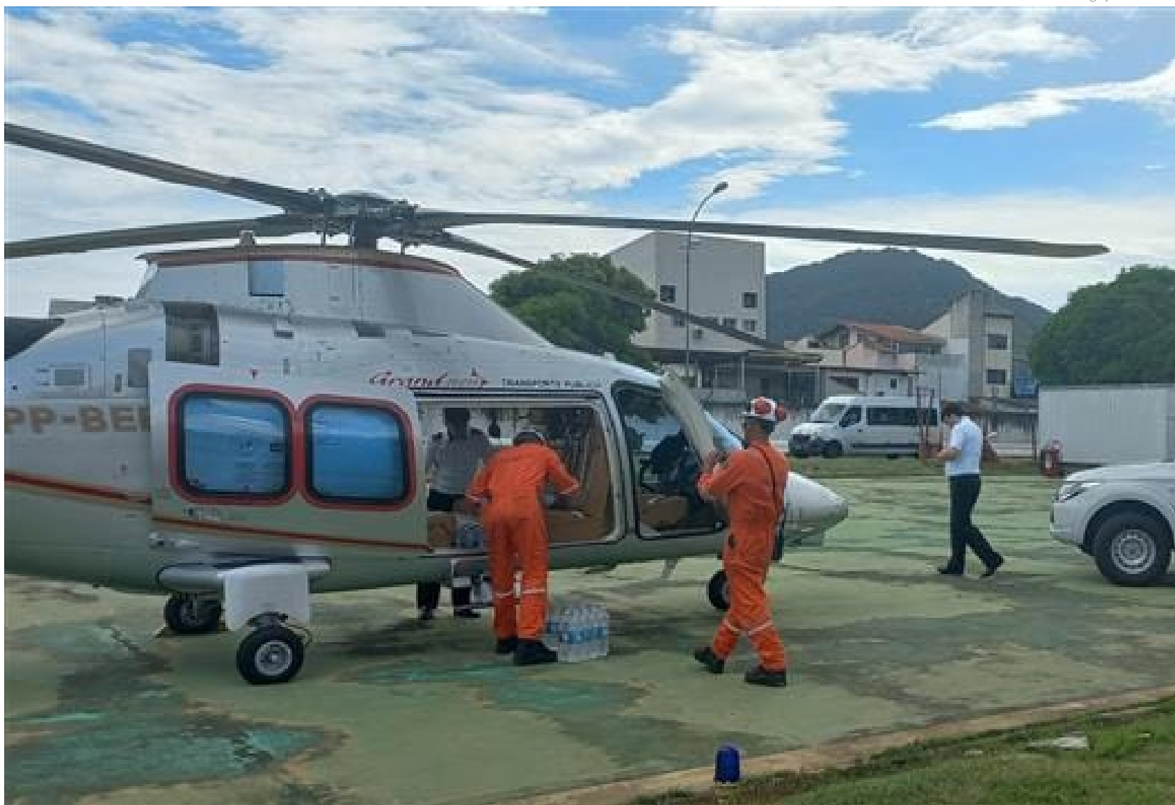
Por meio da Transpetro, a Petrobras mantém operações nos locais afetados para coletar doações do Fundo Social de São Sebastião, que são transportados por helicópteros

VANESSA CAMPOS redacao@portalbenews.com.br