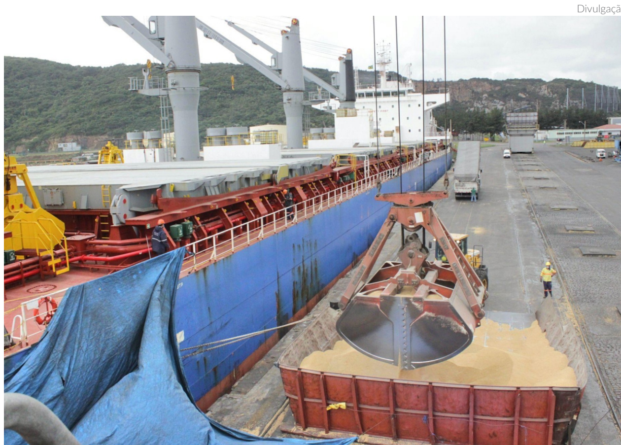
O grupo falou ainda sobre o protocolo de cooperação assinado entre as duas entidades em 2022, que estabeleceu orientações para um intercâmbio entre Ilhéus e Aveiro

“O arroz brasileiro já está presente em mais de 100 mercados e pode apoiar o fornecimento do produto na região asiática”, diz a gerente de Ex-