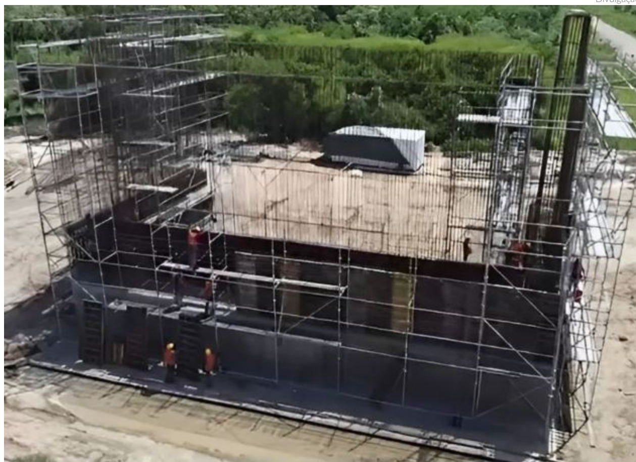
Obras já estão sendo executadas tanto no lado paraguaio quanto no brasileiro, às margens do rio Paraguai

mento nas duas margens do rio Paraguai e em ambos os países, a instalação de estruturas que