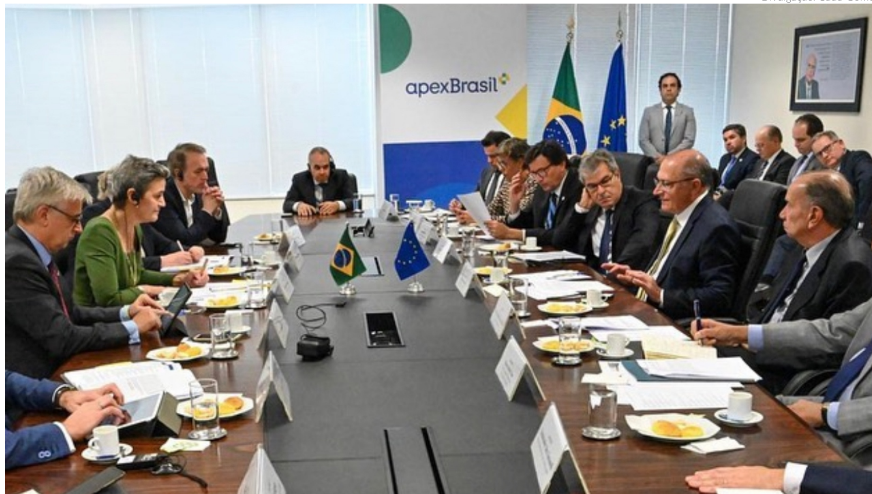
O vice-presidente e ministro do Desenvolvimento, Indústria, Comércio e Serviços, Geraldo Alckmin, se reuniu com a vice-presidente executiva da Comissão Europeia, Margrethe Vestager