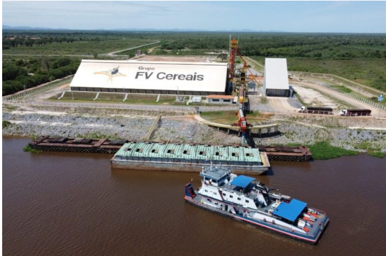
O Grupo FV, que opera o terminal, já tem contratado até o final do ano o equivalente a 675 mil toneladas

Neste bimestre, o terminal – operado pelo Grupo FV – movimentou mais de 122 mil toneladas, resultado considerado um marco no transporte da região. A empresa também já tem contratado até o final do ano o equivalente a 675 mil toneladas. Por ano, o porto tem capacidade de movimentar até dois milhões de toneladas de grãos.