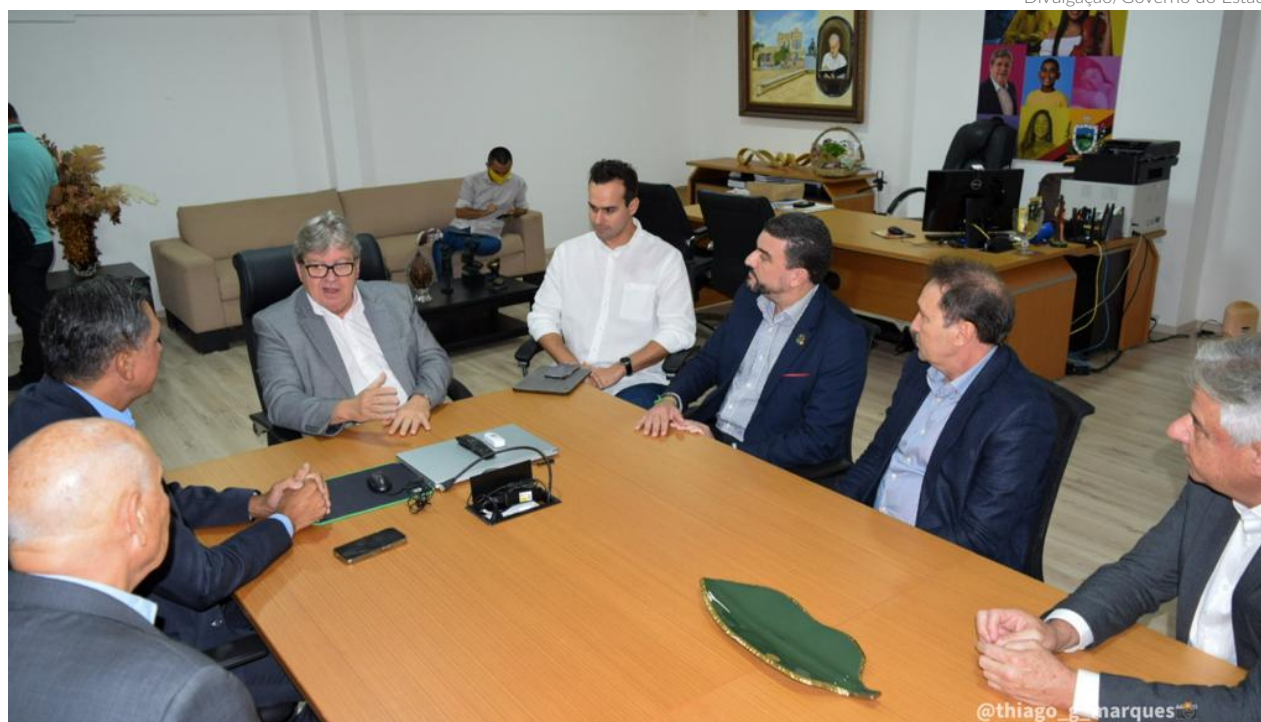
Governador João Azevedo recebeu executivos do Brasil Export e autoridades portuárias do Estado na manhã dessa quinta-feira, na sede do Executivo estadual

O governador da Paraíba, João Azevedo (PSB), anunciou o apoio e confirmou sua participação na próxima edição do Nordeste Export - Fórum Regional de Logística, Infraestrutura e Transportes, a ser realizada na capital do estado, João Pessoa, nos próximos dias 19 e 20 de junho. O evento, considerado a maior conferência sobre transportes e logística do nordeste brasileiro, reunirá lideranças empresariais e autoridades regionais e nacionais.