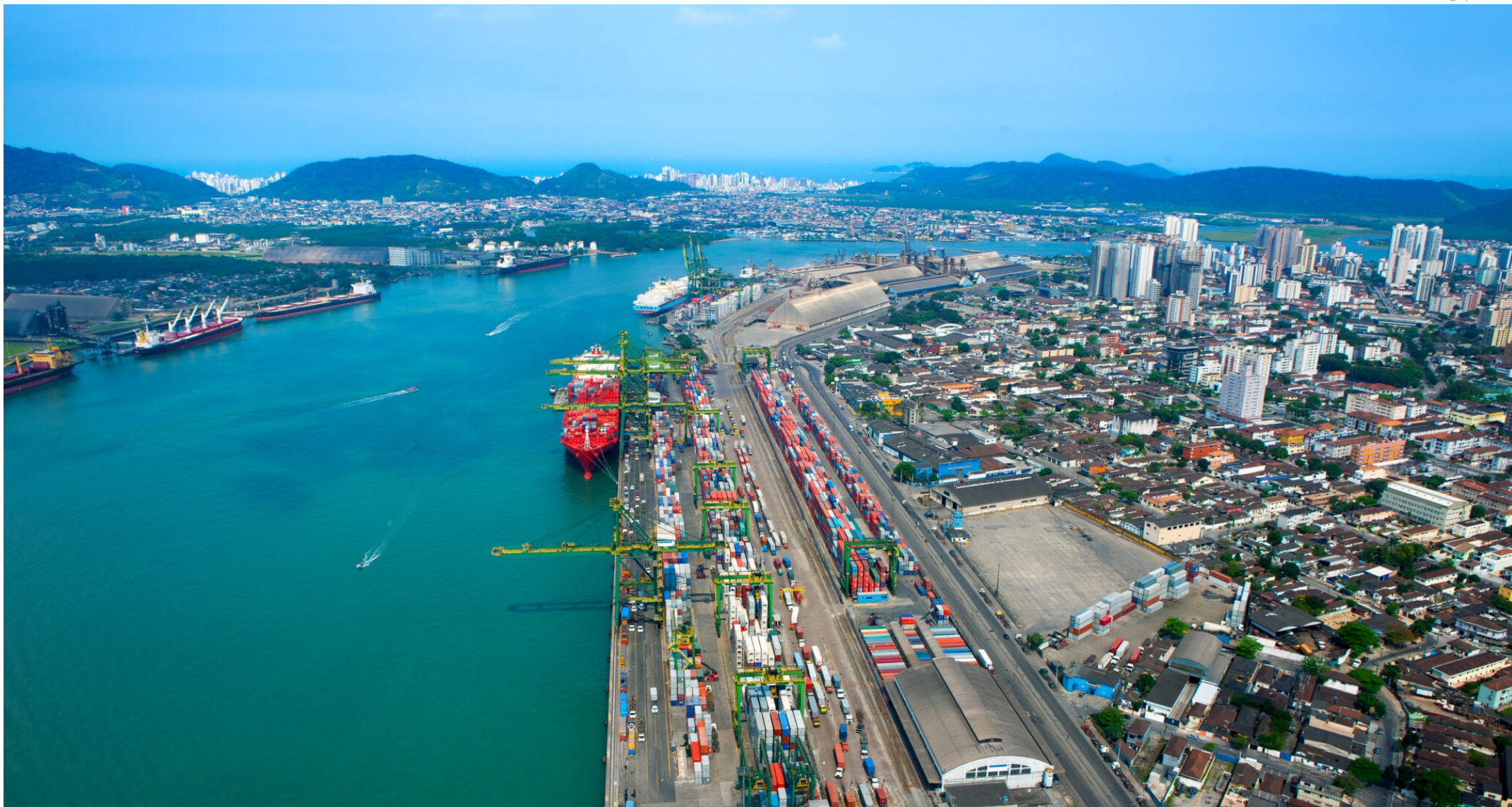
O Porto de Santos atingiu em 2022 a marca recorde de movimentação de 5 milhões de TEU, ficando perto de sua capacidade máxima, que é de 5,3 milhões por ano