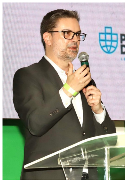
À frente da Secretaria Nacional de Portos e Transportes Aquaviários, Pierdomenico coordena projetos estratégicos para a Região Norte, como a BR do Mar e a BR dos Rios

LEOPOLDO FIGUEIREDO leopoldo.figueiredo@portalbenews.com.br