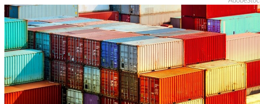
A operação teve como finalidade o aprofundamento de investigação sobre a prática do crime de tráfico internacional de drogas no cais

Na operação de ontem, foram cumpridos ao todo dois mandados de busca e apreensão expedidos pela Justiça Federal de Santos, com a finalidade de aprofundamento de investigação sobre a prática do crime de tráfico internacional de drogas no cais.