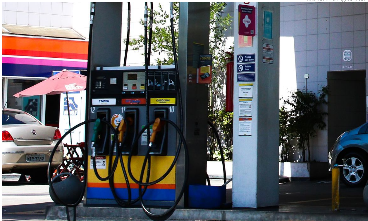
A fixação de uma alíquota única para esses combustíveis estava prevista como parte de um acordo celebrado no fim de 2022 entre União, estados, Distrito Federal e STF

A norma encerra a discussão sobre a forma de cobrança dos impostos. Havia um impasse se a arrecadação deveria ser calculada sobre a quantidade (ad rem) ou sobre o valor da operação (ad valorem). A fixação de uma alíquota única para esses combustíveis estava prevista como parte de um acordo