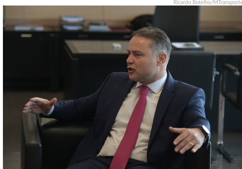
O ministro dos Transportes, Renan Filho, será um dos convidados da Comissão de Viação e Transportes da Câmara dos Deputados

"Dentre as indagações necessárias destaca-se a BR-174. Essa é a principal via de acesso terrestre entre Boa Vista (RR) e Manaus (AM), sendo responsá-