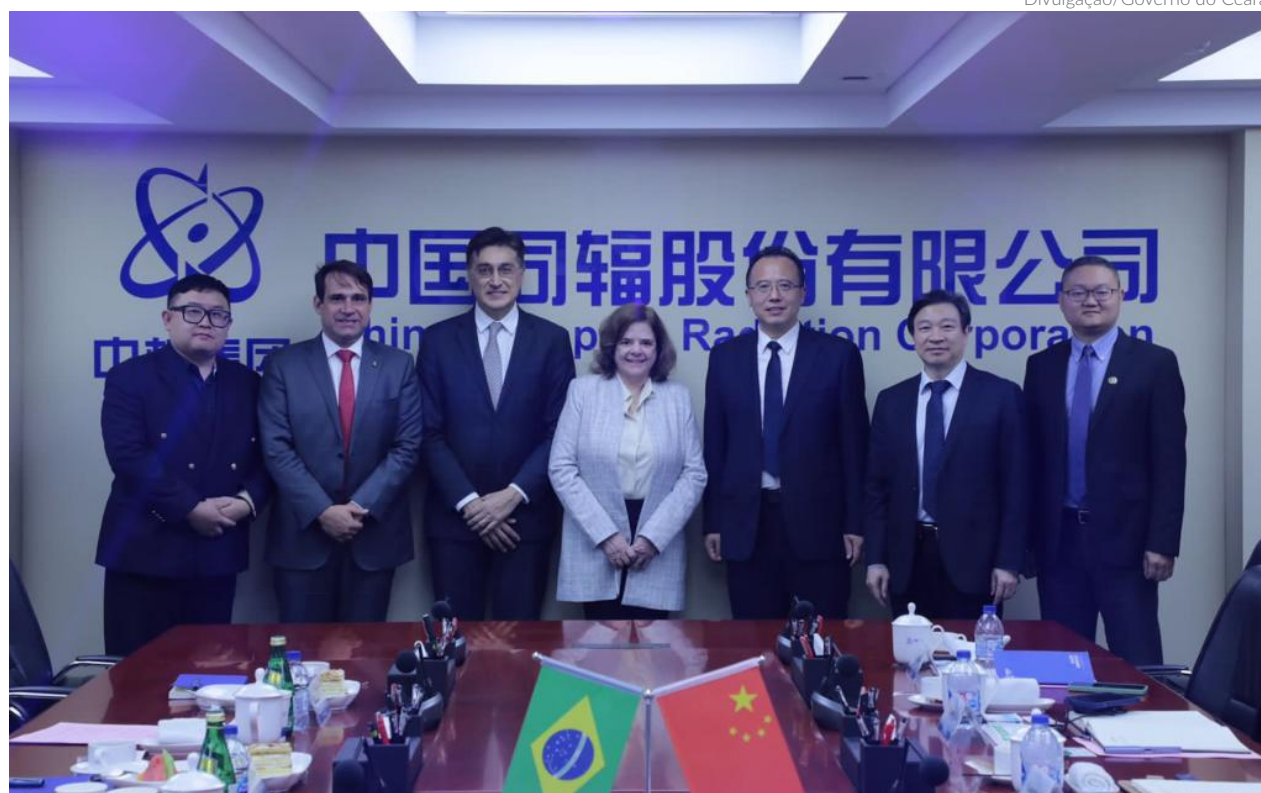
A comitiva do Governo do Ceará segue na China em prospecção de novos investimentos até amanhã

VANESSA PIMENTEL vanessa@portalbenews.com.br