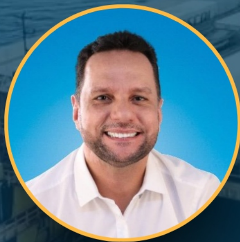
Josenildo Abrantes Deputado Federal (PDT-AP)