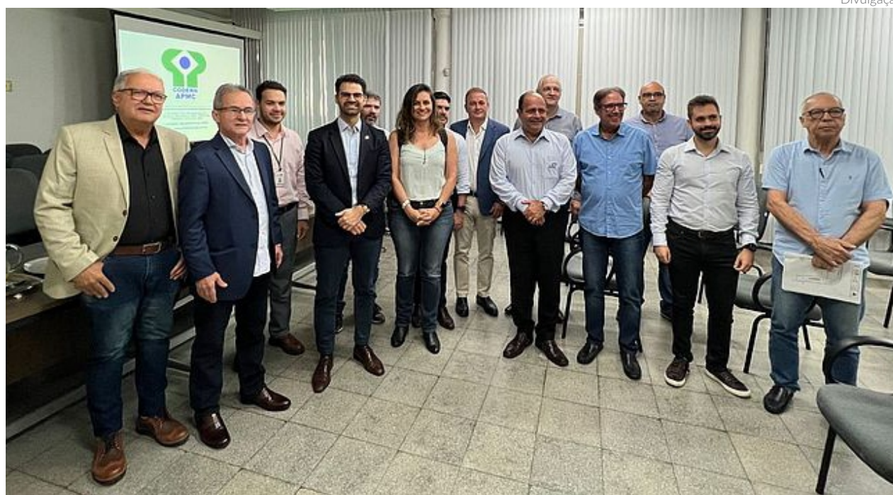
A delegação da Antaq fiscalizou as áreas que têm tancagem de graneis líquidos, o Terminal de Graneis Líquidos e o terminal de passageiros

VANESSA PIMENTEL vanessa@portalbenews.com.br