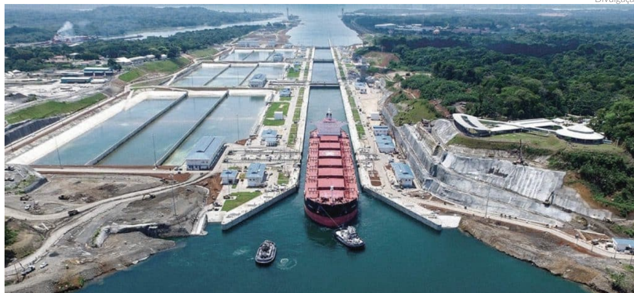
O volume de carga em declínio é motivo de preocupação especialmente para a economia do Panamá

VANESSA PIMENTEL vanessa@portalbenews.com.br