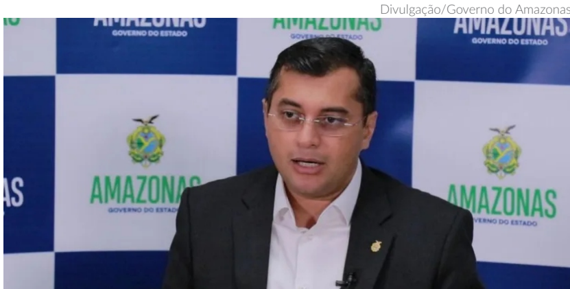
Lima vem defendendo investimentos na infraestrutura de transportes do estado, como a reconstrução da BR-319

Wilson Lima estará na solenidade de abertura do fórum, na noite da próxima segunda-feira, em Manaus (AM)