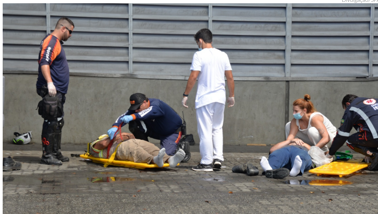
A simulação se deu com um trabalhador sendo atropelado por um caminhão que perdeu o controle dentro do cais, provocando na sequência um incêndio

“Os exercícios simulados ocorrem regularmente e permitem a promoção de orientações a importantes atores envolvi-