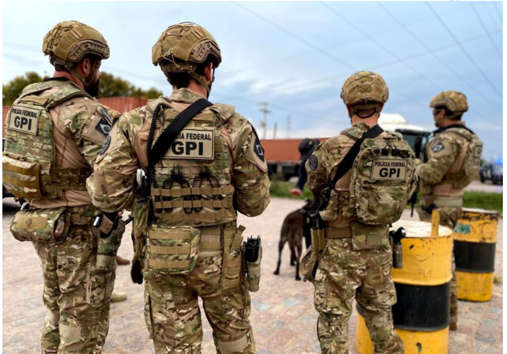
Foram cumpridos 17 mandados de prisão preventiva e 37 mandados de busca e apreensão em cinco estados e no Paraguai

Uma das empresas envolvidas com o esquema criminoso foi a CTIL Logística, que foi cotada para assumir as opera-