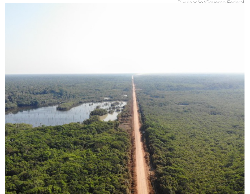
A BR-319 é a única que conecta por terra o Amazonas ao restante do país. A via tem 885 km de extensão e atravessa o coração da Floresta Amazônica

consiga manter o nosso modelo industrial competitivo na ZFM. Em relação ao Porto de Manaus e ao transporte hidroviário de passageiros, temos um projeto de revitalização do porto, na área conhecida como Manaus Moderna, que está em fase de elaboração pela Superintendência Estadual de Navegação, Portos e Hidrovias (SNPH). Entre as melhorias a serem feitas está prevista a construção de mais 400 metros de cais flutuante, para receber as embarcações estaduais, novos