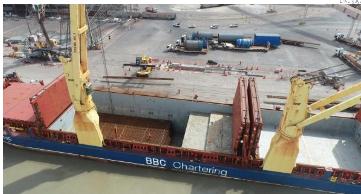
No trimestre, o porto público do Maranhão operou 7,2 milhões de toneladas de cargas, crescimento de 16% comparado ao mesmo período de 2022

No detalhamento por tipo de carga, houve aumento de 10% no granel líquido, 29% no