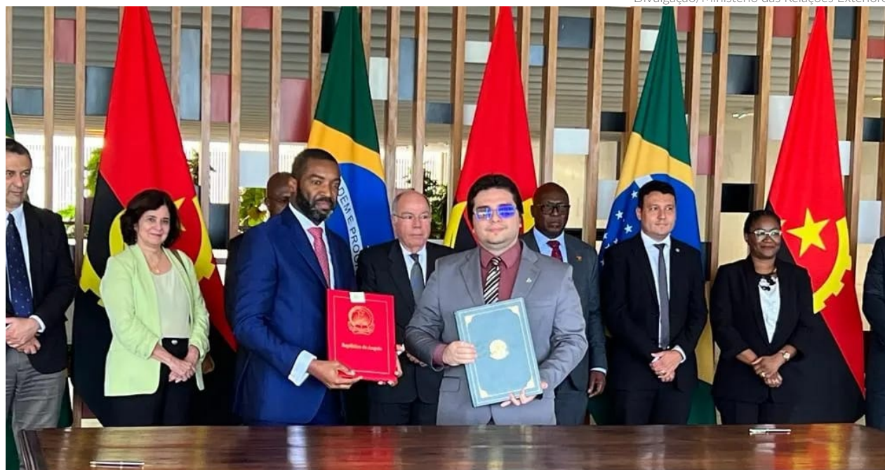
O acordo de cooperação, assinado no último dia 5, em Brasília, é o primeiro na história da Suframa firmado com um país do continente africano

A Zona Franca de Angola fica na província de Bengo e está sob a gestão do órgão