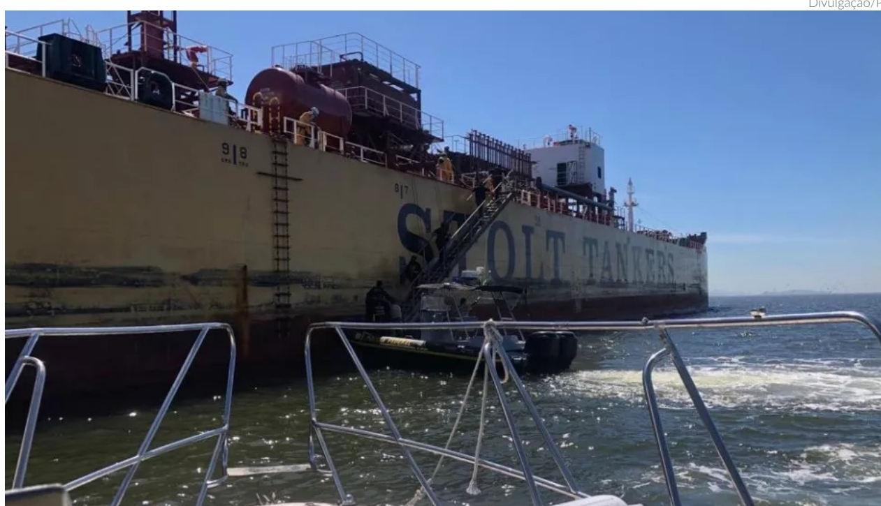
Foi cumprido um mandado de busca e apreensão no navio responsável pelo transporte e bombeamento do produto químico que vazou em grande quantidade

A Polícia Federal afirmou que coletou documentos e informações que ajudarão a reconstituir e compreender o evento. Com isso, juntamente