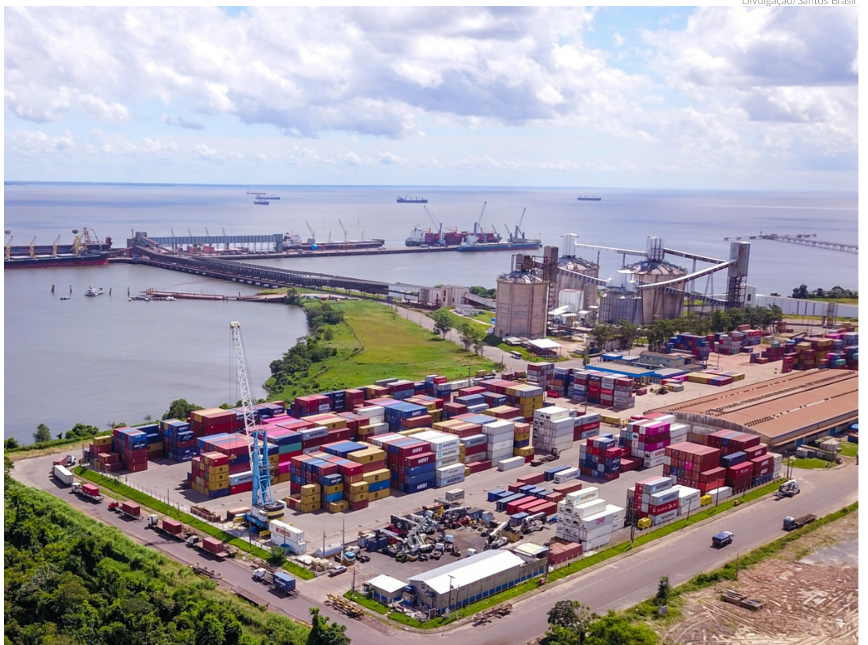
A Santos Brasil adquiriu RECs suficientes para o consumo de megawatt-hora (MWh) relativo aos anos de 2022 a 2025 em Vila do Conde (foto) e Imbituba