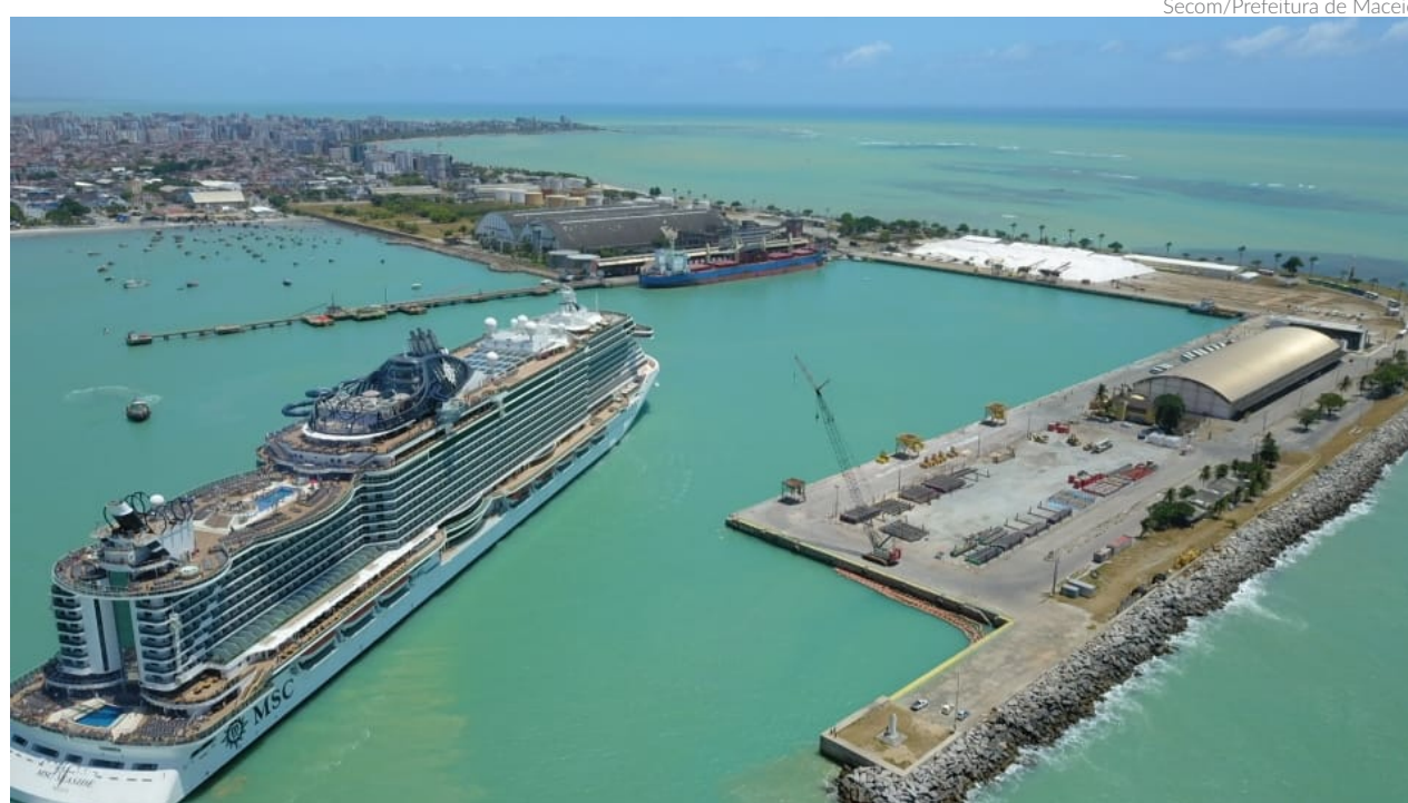
Segundo a Secretaria de Turismo de Maceió, 21 navios que escalaram o porto na temporada atual, contabilizando mais de 76 mil turistas do Brasil e do mundo

o todo, foram 21 navios que escalaram o Porto de Mace-