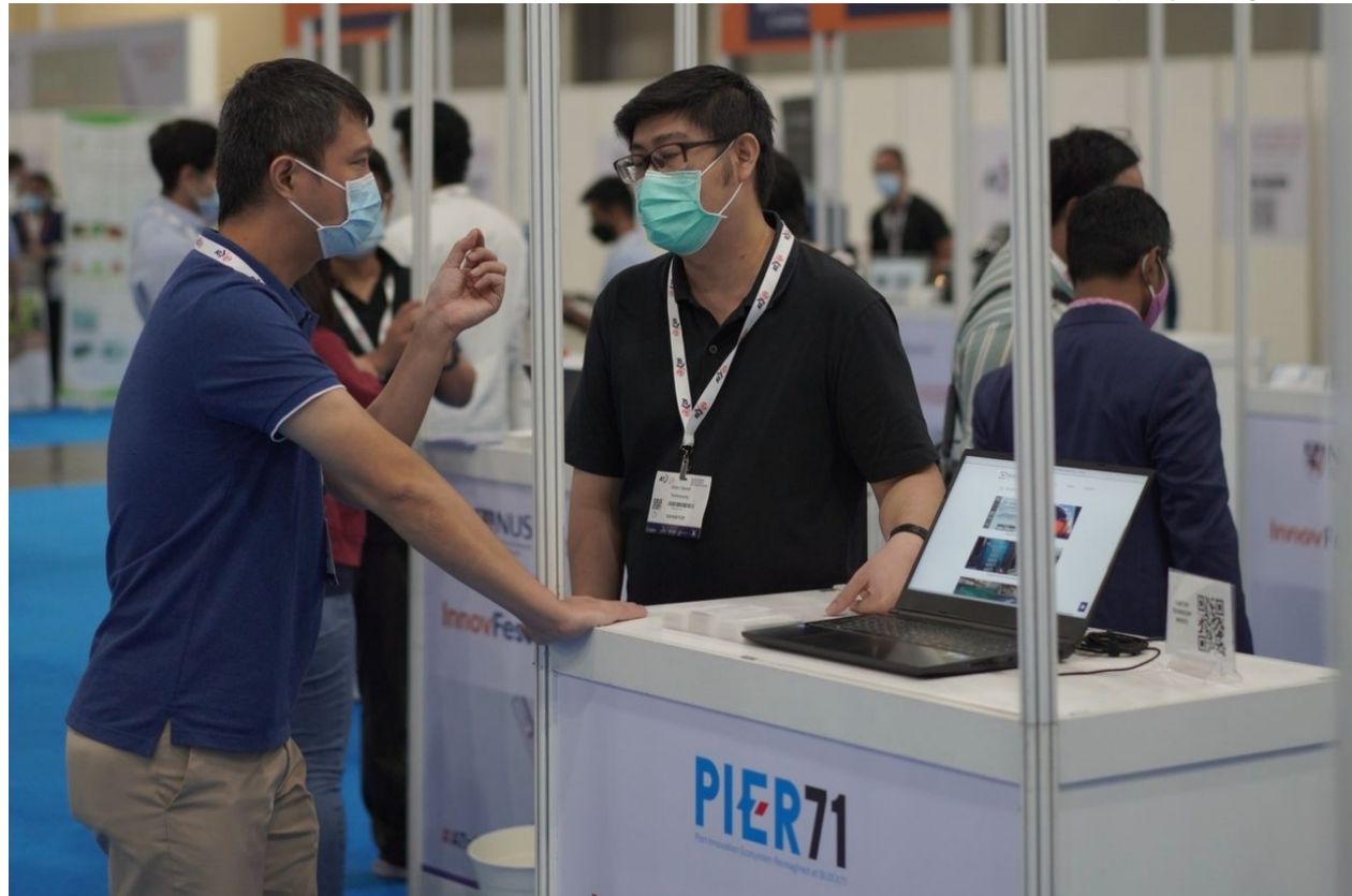
Dentro da programação, o grupo conhecerá o PIER71, principal ecossistema de inovação de Singapura focado no setor marítimo

A missão portuária terá a participação do grupo vencedor do Brasil Hack Export em 2020. A viagem faz parte da premiação oferecida aos campeões do evento, que não puderam viajar na época devido à pandemia de