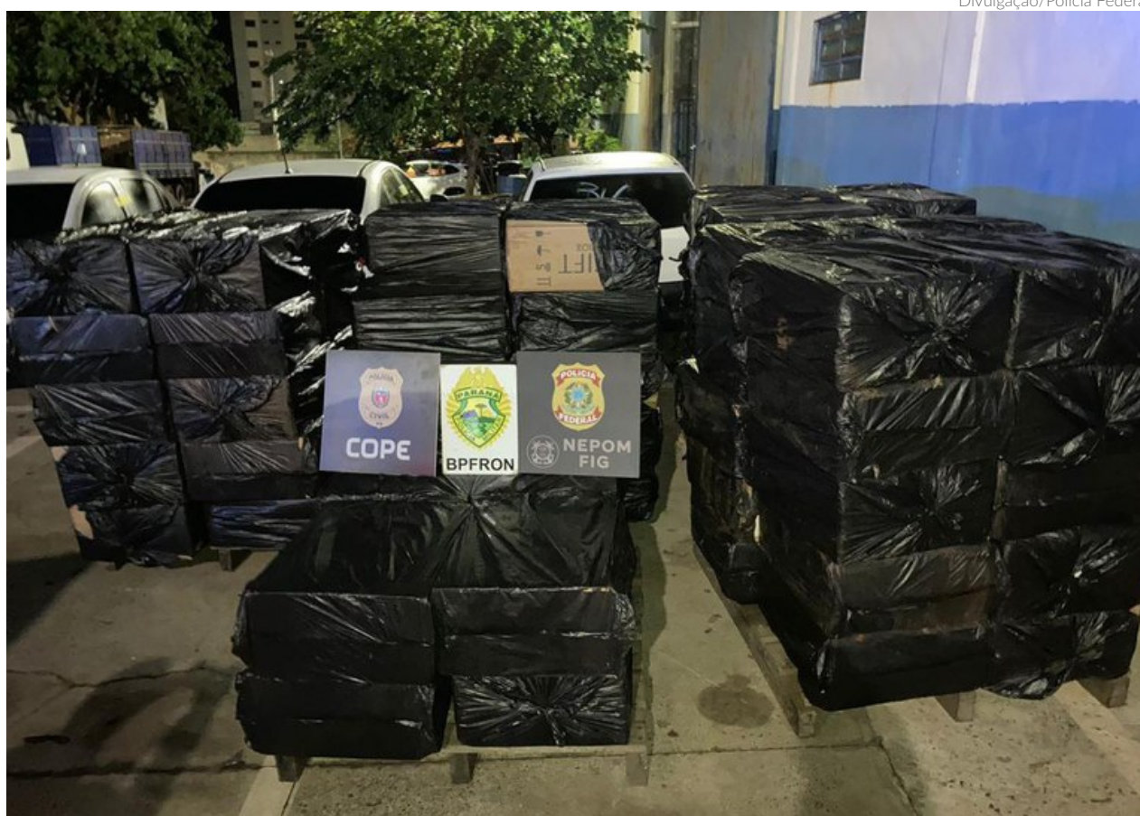
A PF encontrou 93 caixas de cigarros estrangeiros contrabandeados que foram apreendidos e encaminhados para a Delegacia da Receita Federal, em Foz do Iguaçu

Os policiais realizavam patrulhamento na região próxima a um porto clandestino. Com a chegada dos policiais, uma