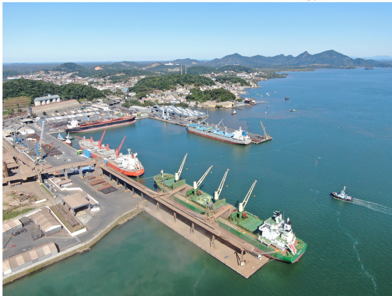
Historicamente, entre os maiores compradores de milho embarcados pelo Porto de São Francisco do Sul estão Egito, Irã, Espanha e Japão

A China passou a aceitar embarques brasileiros de milho a partir do final do ano passado, após aumento de tensões com os Estados Unidos, que era seu principal fornecedor do grão. Entretanto, o país asiático cobrou uma certificação do Ministério da Agricultura junto aos terminais portuários para adequação da exportação do