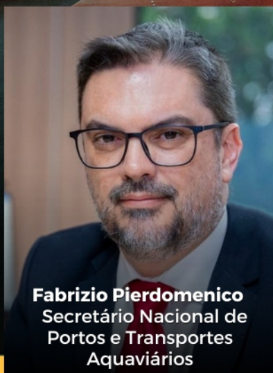
Fabrizio Pierdomenico Secretário Nacional de Portos e Transportes Aquaviários

Presenças confirmadas no mais importante fórum sobre logística, infraestrutura e transportes da região Nordeste