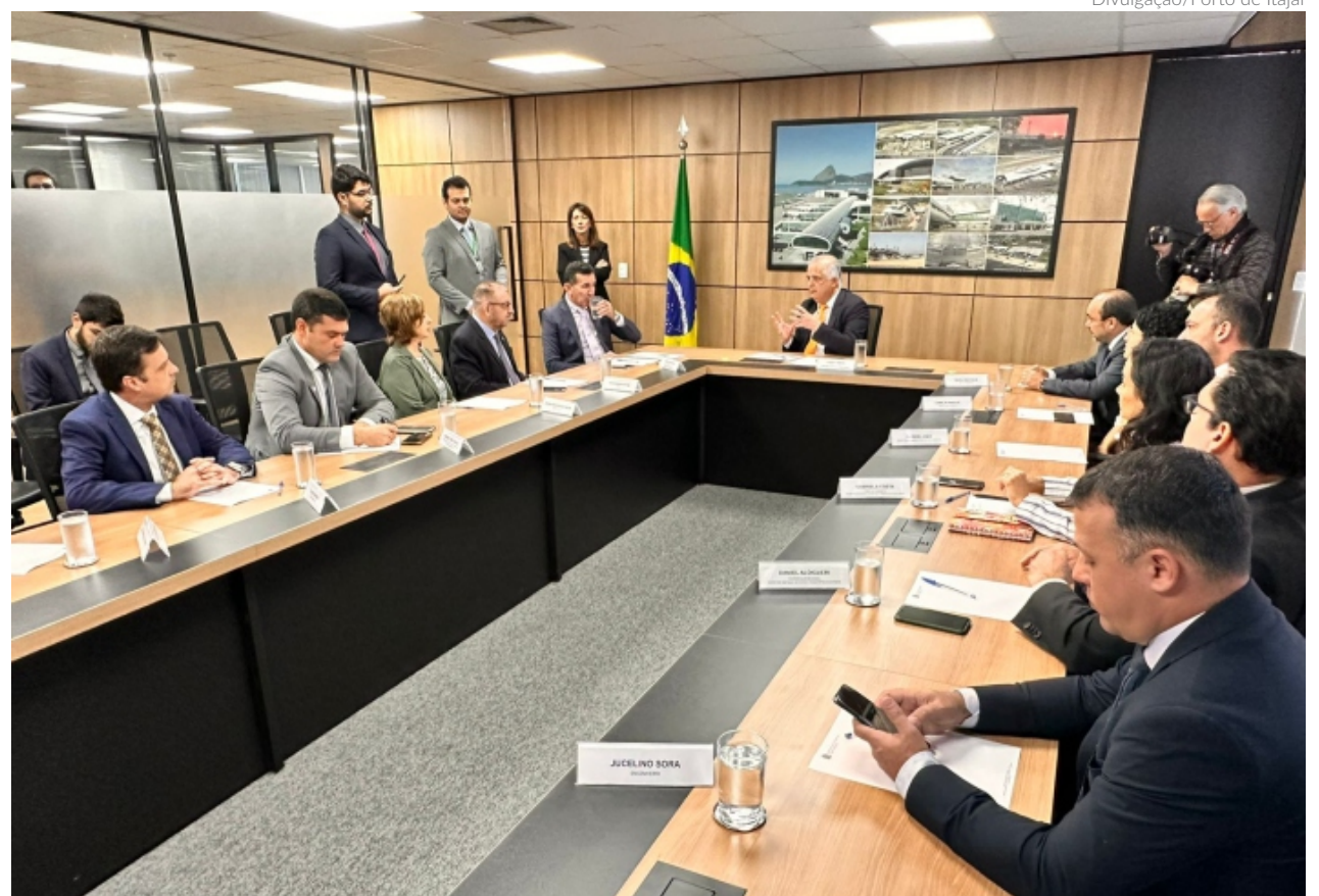
A delegação de Itajaí participou de uma reunião ontem, em Brasília, com o ministro de Portos e Aeroportos, Márcio França

comprometeu a rapidamente assinar o edital de arrendamento definitivo do Porto de Itajaí, este pelo prazo de 35 anos que vai permitir além da expansão portuária para quase o dobro do tamanho [...] para trazer a modernidade definitiva ao porto de Itajaí. Certamente isso vai ser duas, três décadas de pujança financeira, econômica e de qualidade social para todos os itajaienses e região”, afirmou Fábio de Veiga.