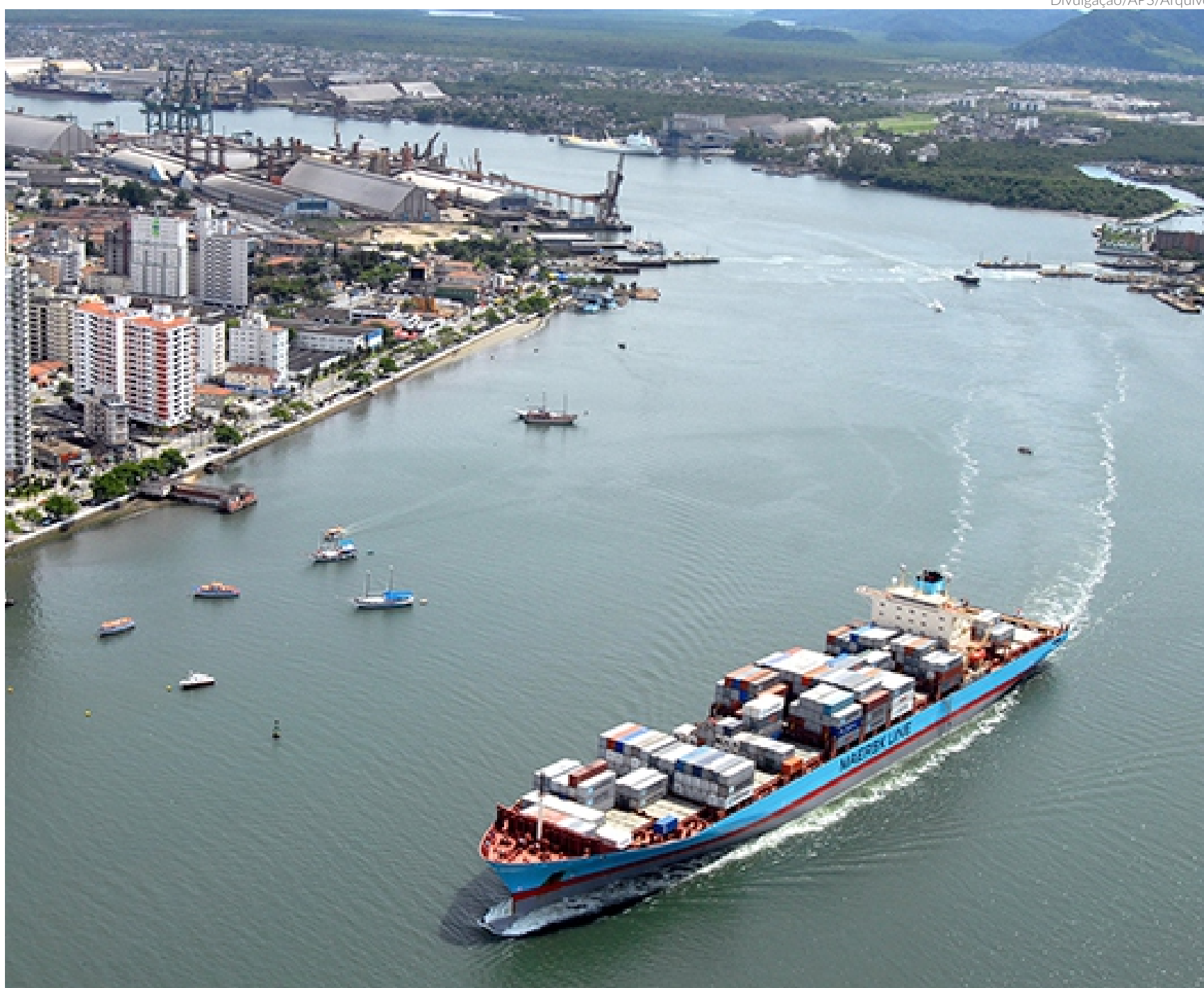
O Porto de Santos destacou-se como o de maior movimentação, com 11,88 milhões de toneladas, apresentando um aumento de 5,54% em comparação a maio de 2022