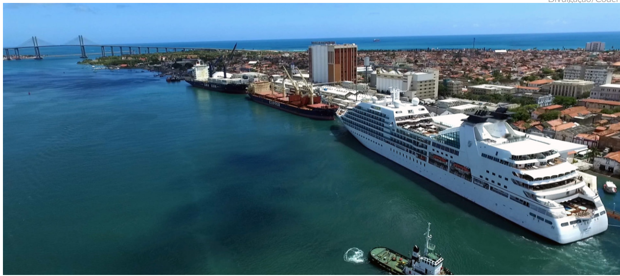
A profundidade do canal de acesso e da bacia de evolução do Porto de Natal é de 12 m. Mas devido à falta de manutenção, são permitidos navios com calado máximo de 10 m

VANESSA PIMENTEL vanessa@portalbenews.com.br