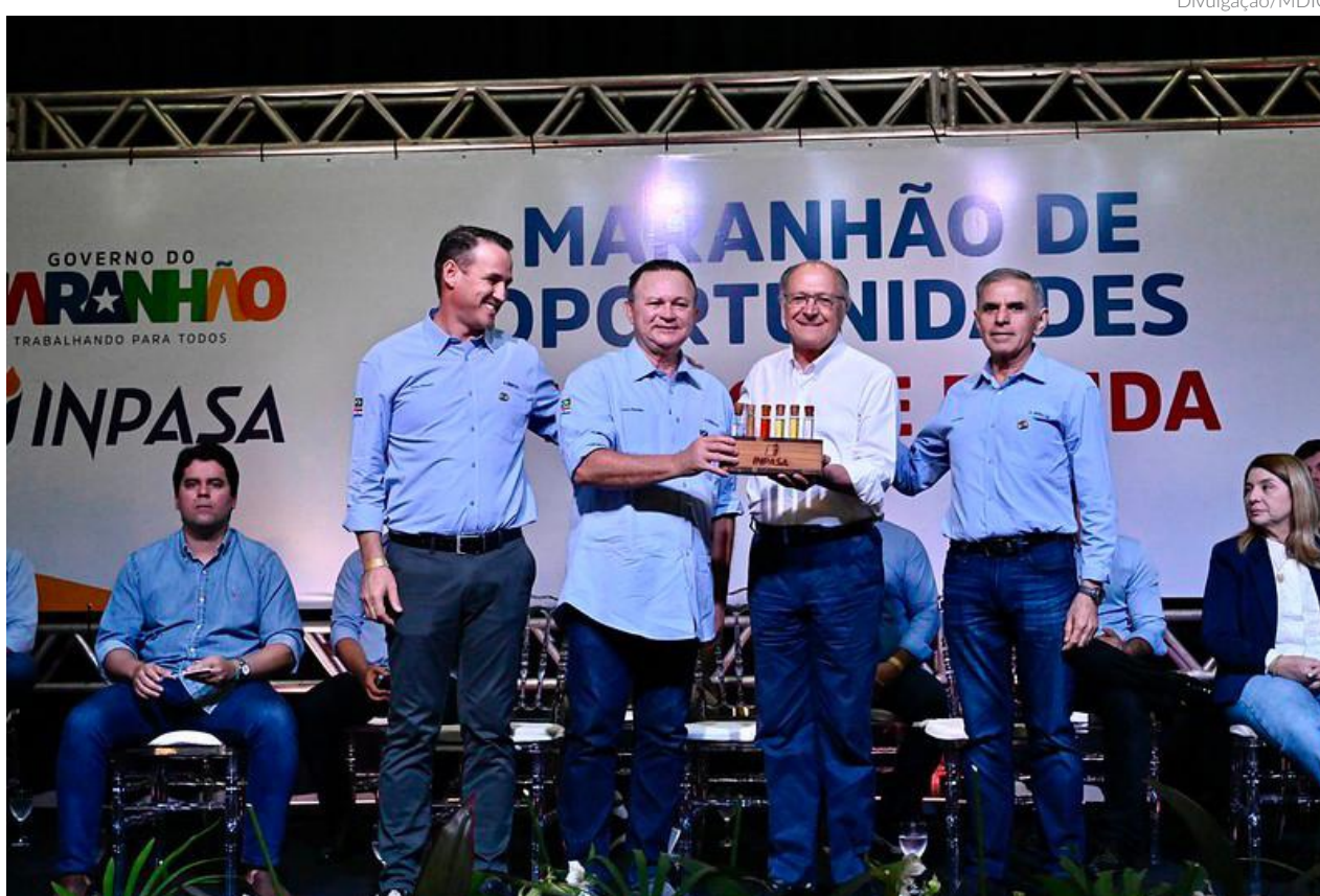
Vice-presidente comemorou a geração de vagas de emprego, que podem chegar a 2.500 na fase de construção da fábrica e 1.500 com o início da operação

“Dia de comemoração, um dos maiores investimentos do