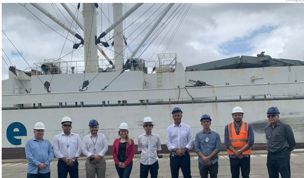
Representantes da Fiem e da Mercosul Line durante visita ao Porto de Natal para conhecerem as potencialidades do complexo

No dia 4 de outubro, Nino recebeu na sede da Autoridade Portuária representantes da Mercosul Line, empresa especializada em cabotagem, para tratar da implantação de uma