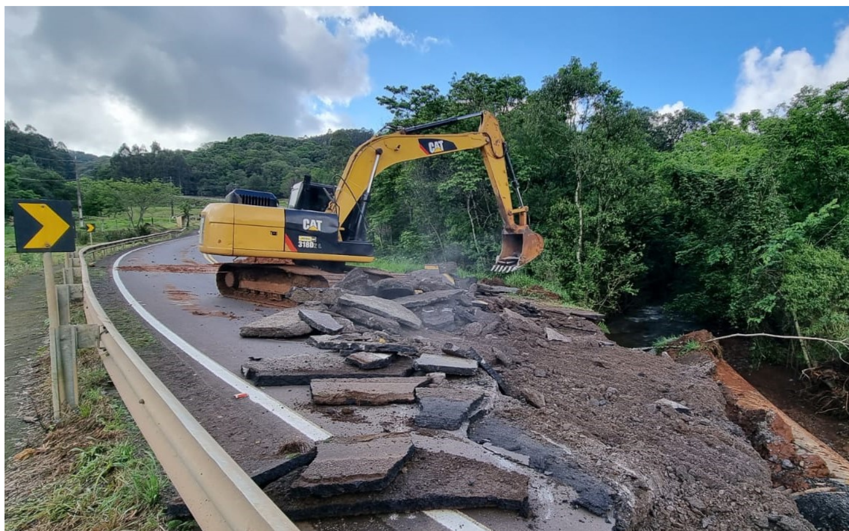
Na segunda-feira, com a melhora no clima, começaram os trabalhos de reconstrução e recuperação de vias interditadas em todo o Estado

Desde a semana passada, foram registrados 58 ocorrências nas estradas