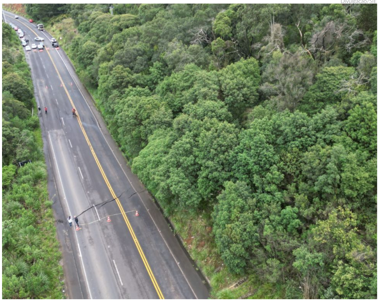
A Secretaria de Estado da Infraestrutura e Mobilidade verificou 58 ocorrências registradas em várias das 131 rodovias estaduais que cortam Santa Catarina

Segundo o governo estadual, o mapa digital é atualizado de forma constante, levando informações precisas aos motoristas que precisam acessar algumas das rodovias para poderem se informar sobre a situação de cada uma delas.