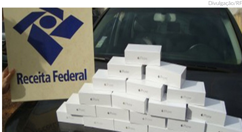
Entre os produtos disponíveis estão iPhone 14 e Apple Watch a partir de R$ 2,8 mil no lote 6, além de aparelhos da Xiaomi. Há também iPhone 11 com lance inicial de R$ 1 mil

Entre os produtos disponíveis, o destaque vai para iPhone 14 e Apple Watch a partir de R$2,8 mil no lote 6, além de