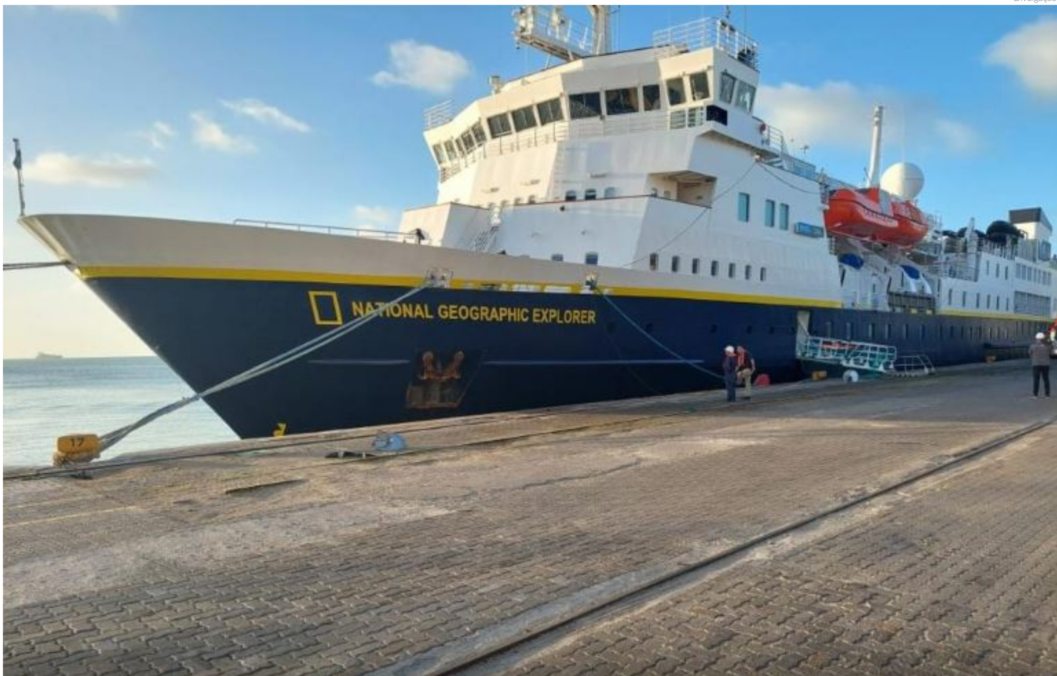
Com 150 passageiros a bordo, o navio National Geographic é uma das nove embarcações previstas para atracar no Porto de Fortaleza durante a temporada de cruzeiros 2023/2024

VANESSA PIMENTEL vanessa@portalbenews.com.br