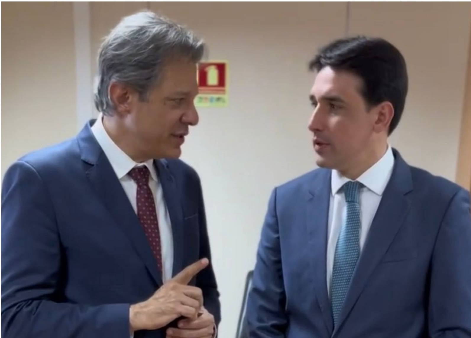
O ministro de Portos, Silvio Costa Filho, postou um vídeo nas redes sociais em que aparece ao lado do ministro da Fazenda, Fernando Haddad, confirmando a extensão do Reporto