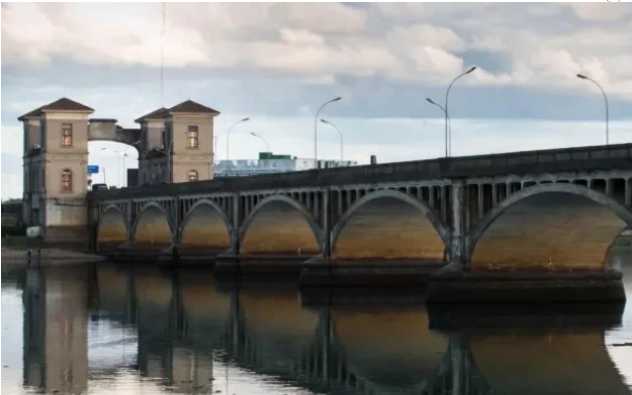
Entendimentos incluem uma segunda ponte no rio Jaguarão, na BR-116RS

O objetivo dessas intervenções é ampliar a segurança do tráfego de embarcações e facilitar o escoamento de cargas na região Sul do continente sulamericano. A dragagem e sinalização serão conduzidas pelo canal de São Gonçalo, conectando as duas lagoas, no trecho entre o Canal do Sangradouro (Extremo Norte) e o Canal de Acesso ao Porto de Santa Vitória do Palmar (Extremo Sul), com previsão de lançamento do edital em dezembro.