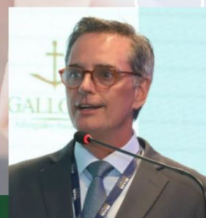
Celso Peel Desembargador do Tribunal Regional do Trabalho de São Paulo (TRT/SP)