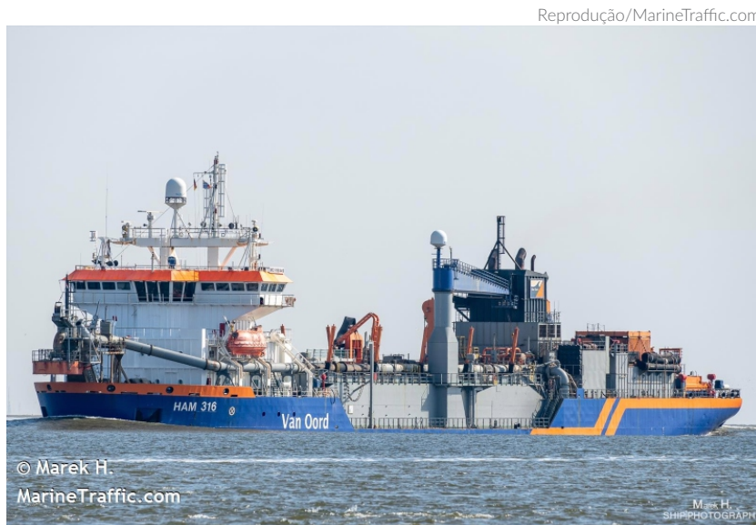
A draga HAM 316, do tipo sucção, atuará em paralelo com a draga NJORD e está trabalhando 24 horas ininterruptas com os serviços de dragagem desde a sua chegada

Há mais de um mês, Itajaí, região da Associação dos Municípios da Região da Foz do Rio Itajaí (AMFRI) e praticamente