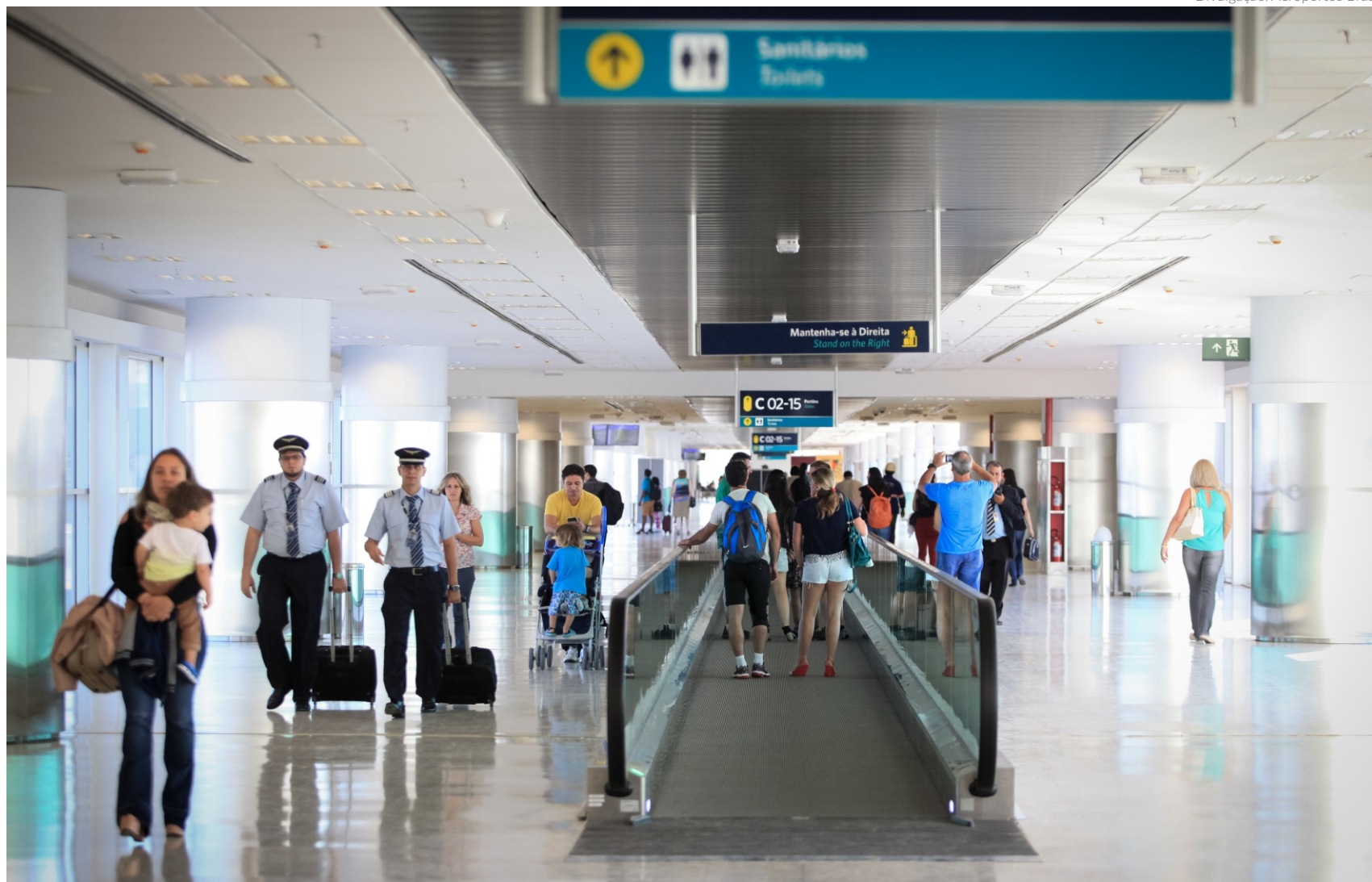
A alta da movimentação de passageiros internacionais em Viracopos de janeiro a outubro deste ano é de 63,39%, sendo 929,1 mil, ante 568,6 mil no mesmo período de 2022

No quesito de voos para o exterior, os números de janeiro a outubro já superaram o total de passageiros que viajaram para