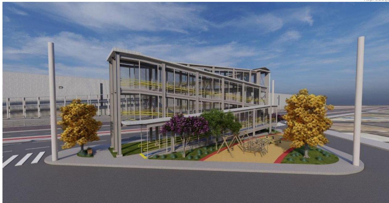
A Passarela Eldorado será construída na confluência das ruas Coronel Raposo de Almeida e Professor João de Lima Roland com a Avenida Mário Covas, no bairro Estuário

Além da construção da futura passarela, a empresa também será responsável pela revitalização de uma praça que existe no local. A previsão inicial