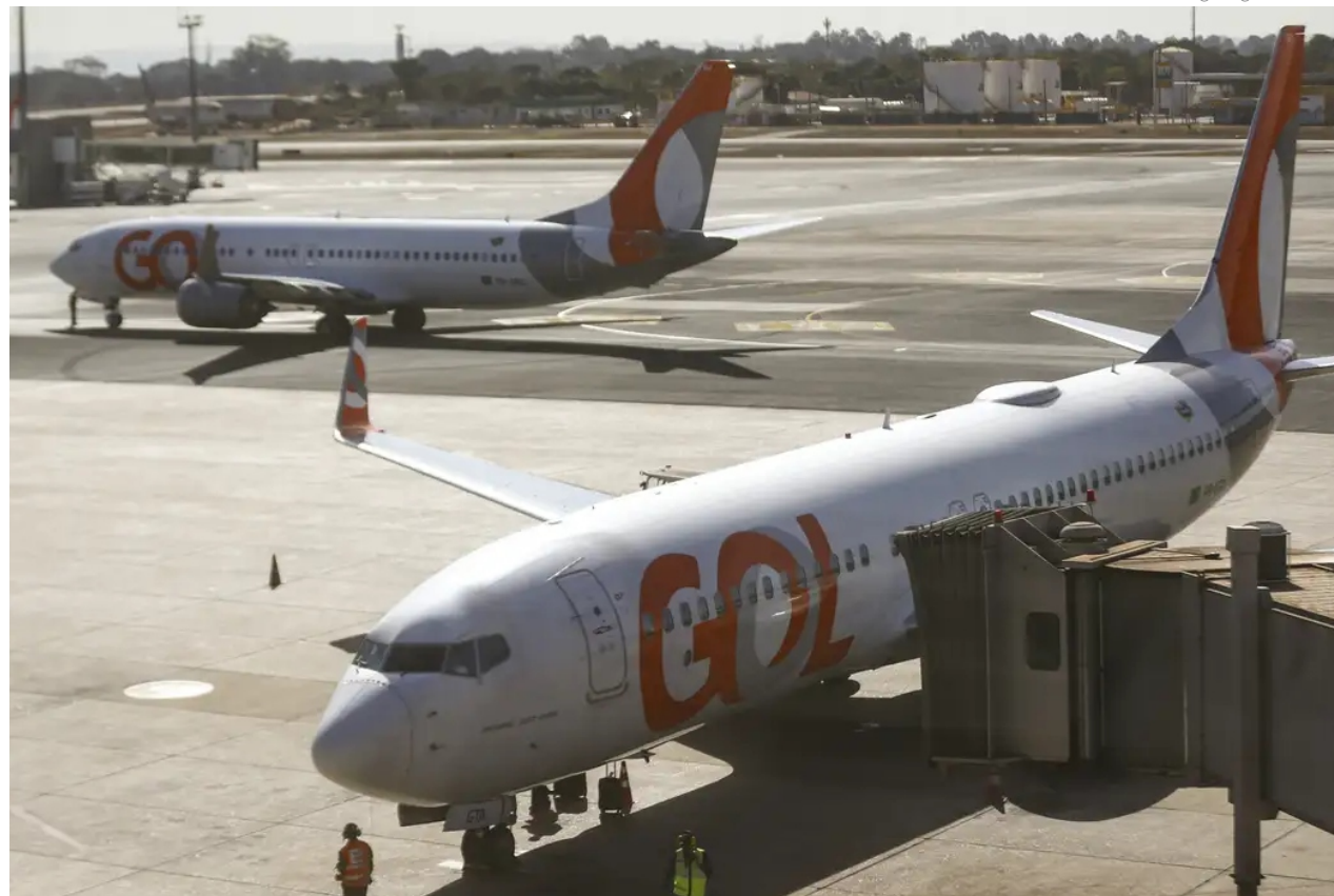
A nova rota da Gol de Vitória para Brasília entrou em operação no dia 29 de outubro, enquanto a operação a Porto Seguro se iniciou em 4 de novembro, ambas com voos diretos

A operação para o Distrito Federal atende não só à demanda local de viajantes a negócios ou lazer, mas também permite que os clientes capixabas tenham acesso mais fácil à diversos destinos nacionais nas regiões Norte, Nordeste e Centro-Oeste, como Cuiabá (MT), Manaus (AM), Rio Branco (AC), Porto Velho (RO), Belém (PA),