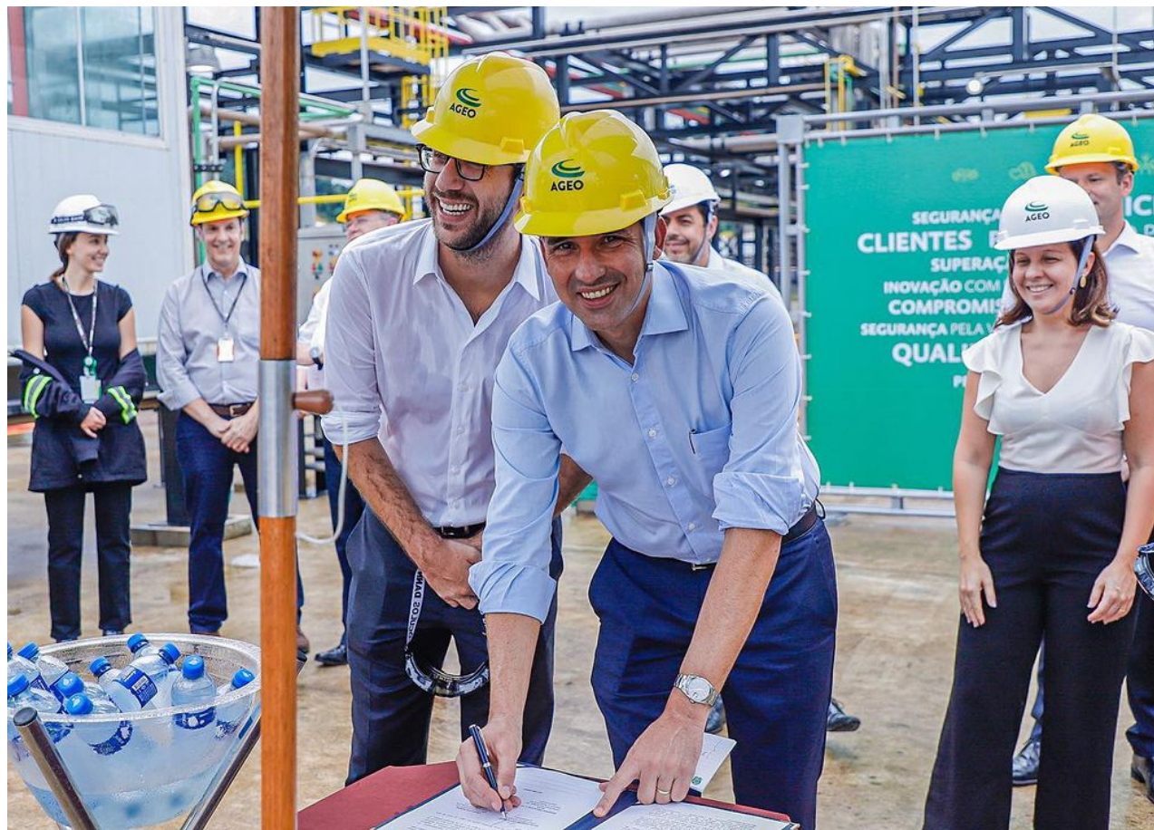
Durante a solenidade, o ministro Silvio Costa Filho assinou a portaria para que a administradora dos Terminais Ageo realize a construção de nova bacia de tancagem

O ministro destacou que essa entrega não apenas repre-