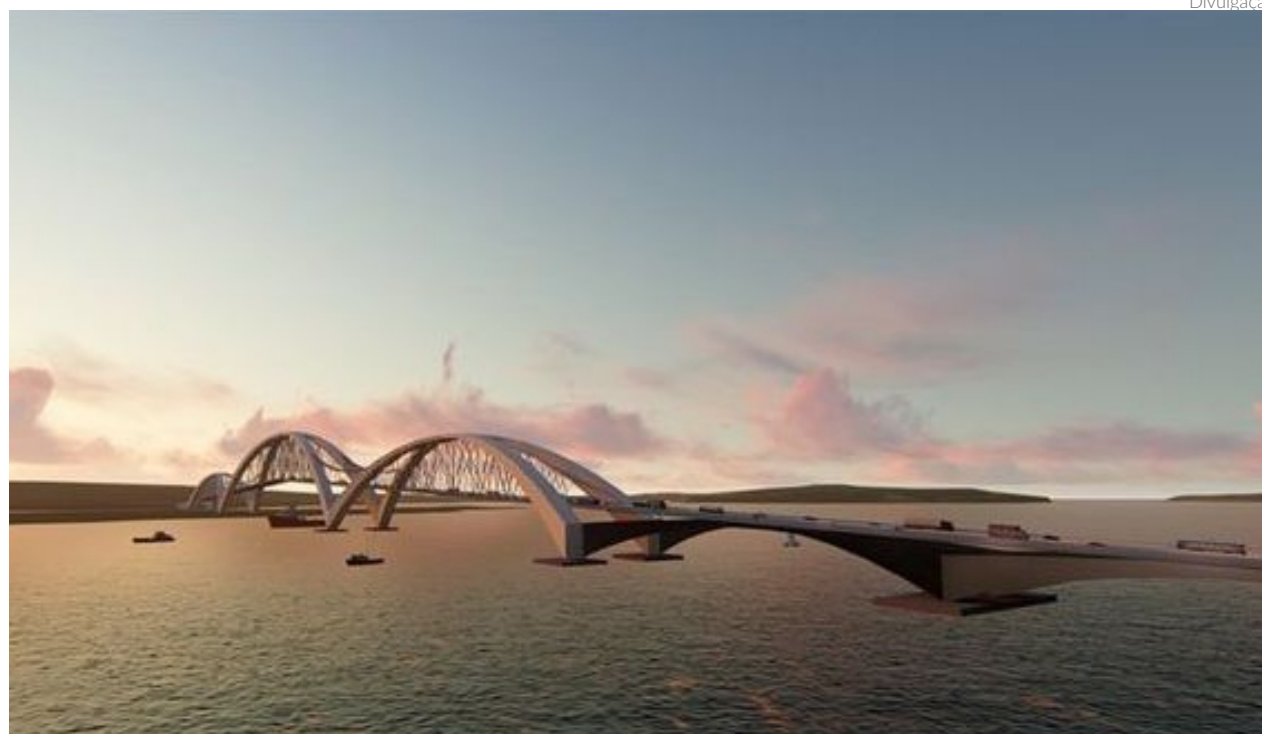
O projeto indica que o novo equipamento terá 2.200 metros de extensão e sairá da Praia do Jacaré até a cidade de Lucena e, em seguida, para a BR-10, em Santa Rita

VANESSA PIMENTEL vanessa@portalbenews.com.br