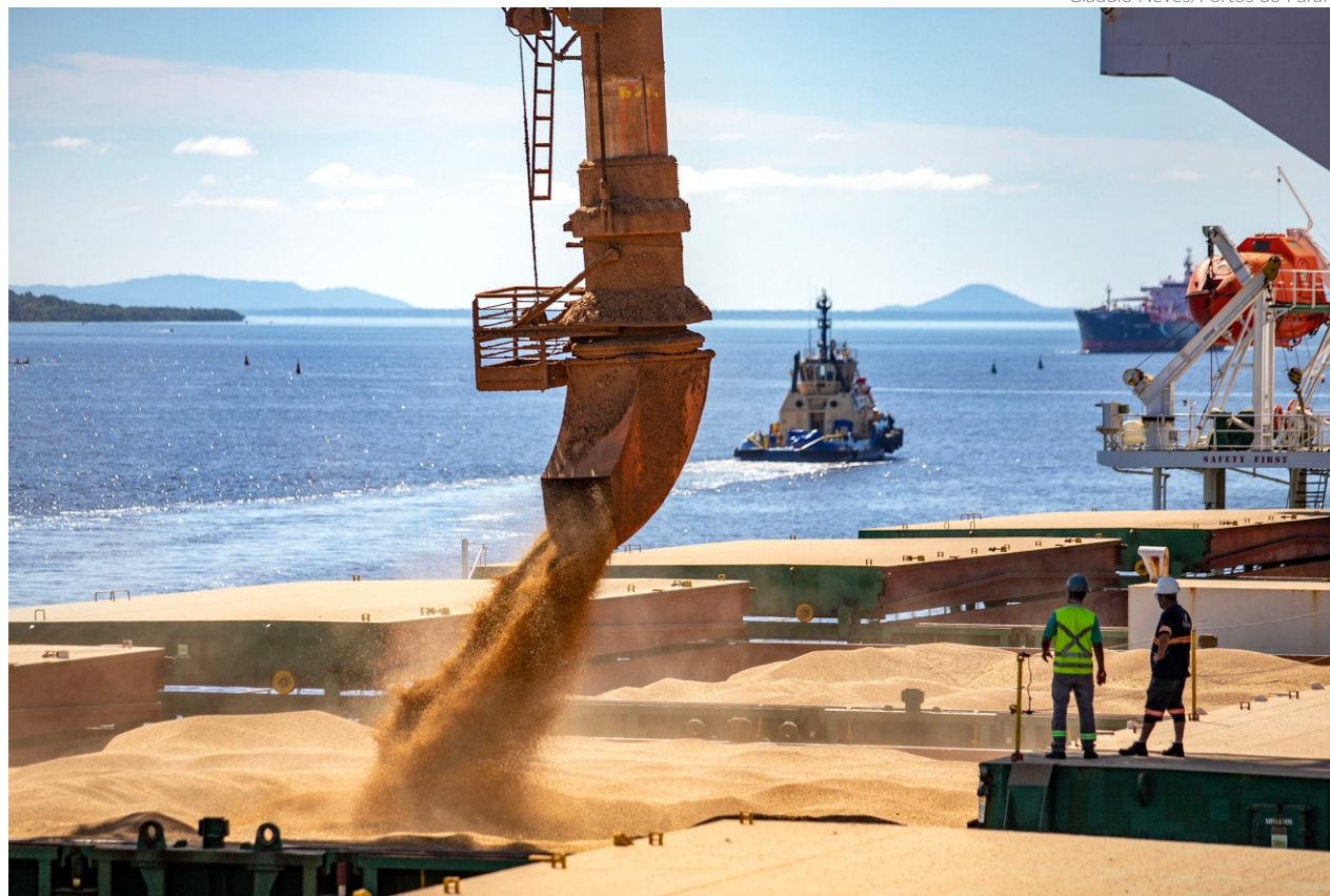
A movimentação total de cargas, incluindo importação e exportação, foi de 53.360.117 toneladas, 3,66 milhões de toneladas a mais no comparativo ao ano anterior

demanda de mercado, estamos trabalhando pesado no sistema operacional e focando em estratégias para crescimento da Portos. Nos próximos meses teremos o início da construção do Moegão, sistema exclusivo de descarga ferroviária de grãos e