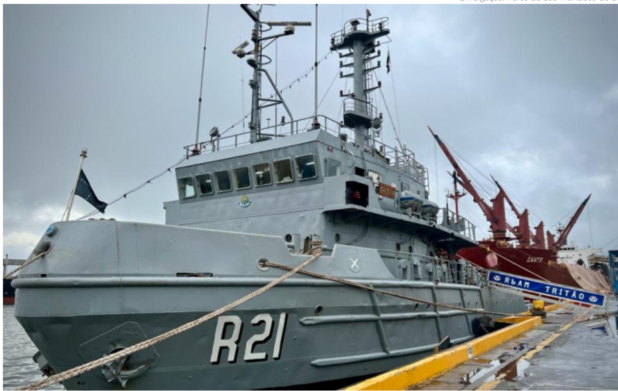
O rebocador Tritão, de 53 metros de comprimento, é utilizado para patrulha naval, socorro e salvamento de navios no mar e segurança nos portos, além de reboque

A presença do navio em São Francisco do Sul ocorre durante as comemorações da Semana da Marinha, neste mês de dezembro, que tem diversas atividades esportivas e culturais na cidade.