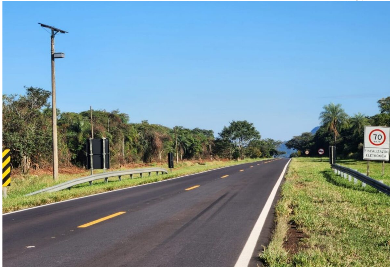
O estado informou que esta fase do programa prevê a reabilitação de, aproximadamente, 470 km de rodovias transversais selecionadas para integração com as rodovias radiais

Sem citar quais as estradas beneficiadas, o estado informou que esta fase do programa prevê a reabilitação de, aproximadamente, 470 km de rodovias