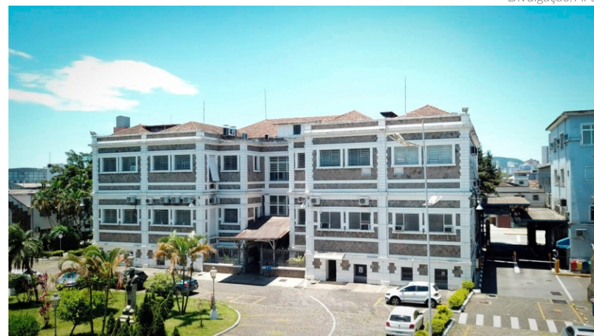
A realização do concurso estava sendo organizada desde o início deste ano, mas só foi possível após o Governo retirar a APS do Programa Nacional de Desestatização

A Autoridade Portuária de Santos (APS) anunciou a contratação da Fundação para o Vestibular da Universidade Estadual Paulista Júlio de Mesquita Filho (Vunesp) para a realização do concurso público previsto para o ano que vem. O concurso oferece um total de 250 vagas para a companhia que administra o Porto de Santos.