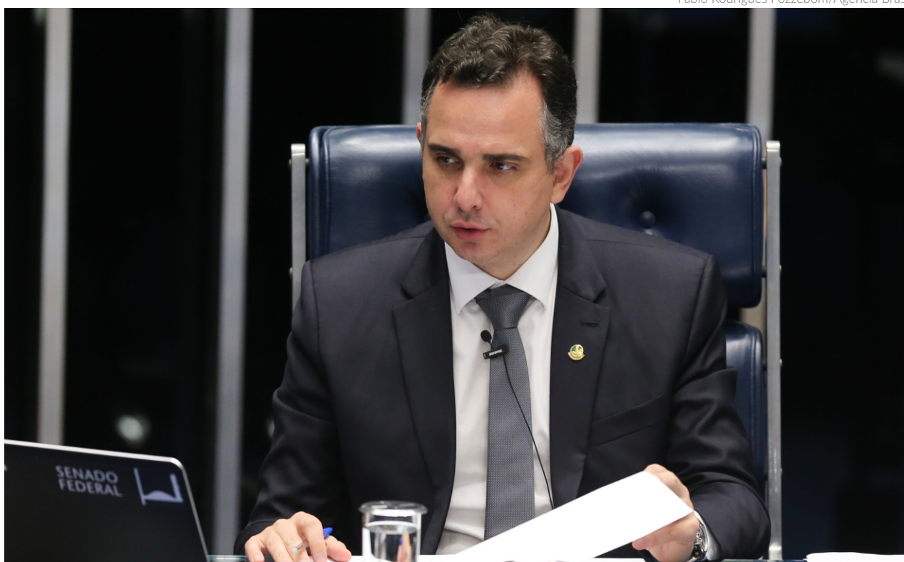
O presidente do Congresso Nacional, Rodrigo Pacheco, destacou o compromisso do Legislativo com o déficit zero e a possibilidade de discutir alternativas à reoneração da folha

YOUSEFE SIPP redacao@portalbenews.com.br