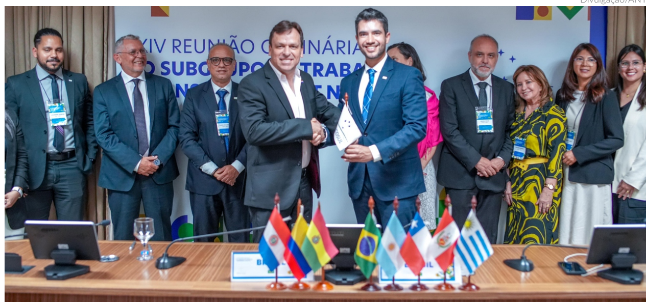
Reunião Ordinária do Subgrupo de Transportes do Mercosul, realizada em novembro e liderada pela ANTT: o Brasil é membro de vários organismos de integração regional

zes apresentadas, o PLAI destaca a necessidade do alinhamento do posicionamento interno e demais órgãos do governo brasileiro, além da busca por uma harmonização regulatória multilateral entre os países parceiros, visando ampliar a integração dos transportes terrestres. Também ressalta a necessidade de obter a concordância prévia do país parceiro em relação ao desenvolvimento de projetos