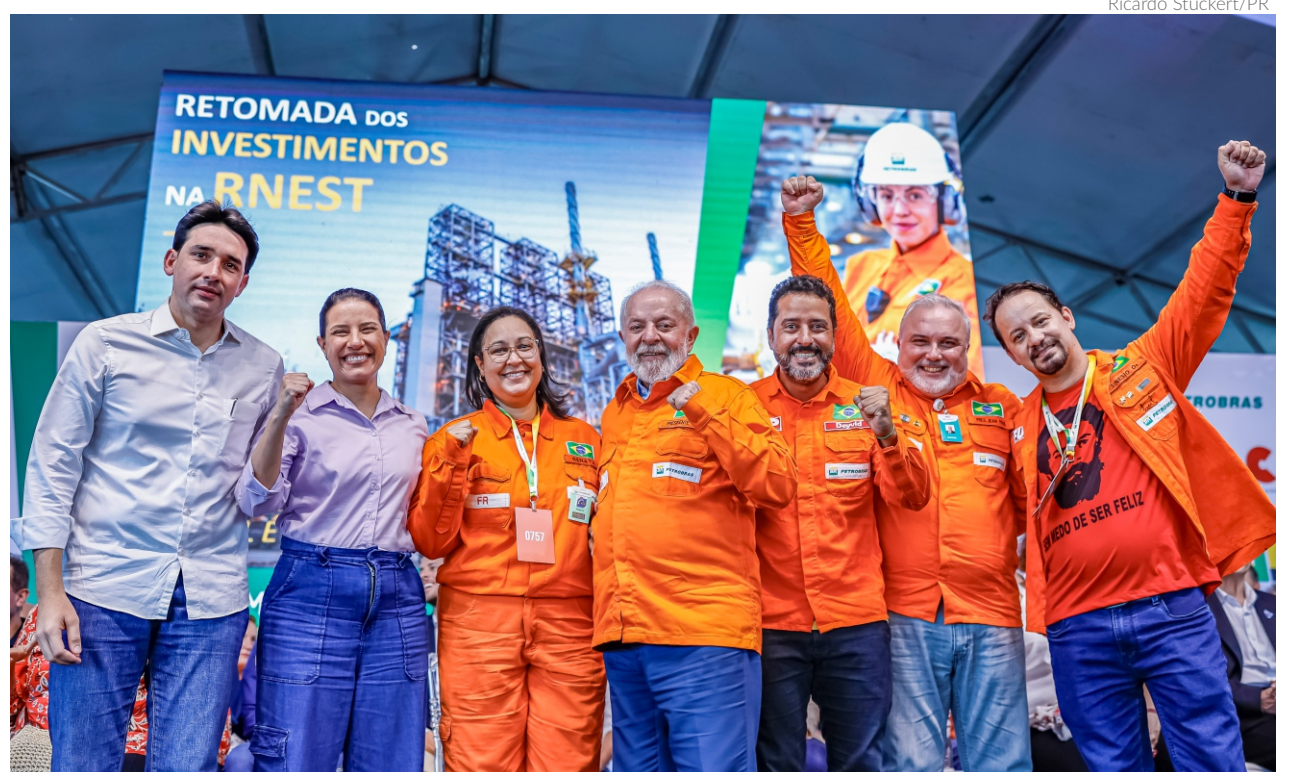
A cerimônia de retomada de investimentos da Refinaria Abreu e Lima teve a presença do presidente Lula e do presidente da Petrobras, Jean Paul Prates, entre outras autoridades

Paralelamente, a Petrobras lança o Programa Autonomia e Renda, que oferecerá cursos de capacitação profissional a pessoas em situação de vulnerabilidade socioeconômica. Em parceria com o Sesi-Senai e Institutos Federais, o programa busca capacitar pessoas para atuar no setor de Energia, priorizando grupos minorizados. A primeira fase atenderá a sete estados, com mais de 19 mil vagas e benefícios como bolsa-auxílio, reforço escolar e cursos para desenvolvimento socioemocional.