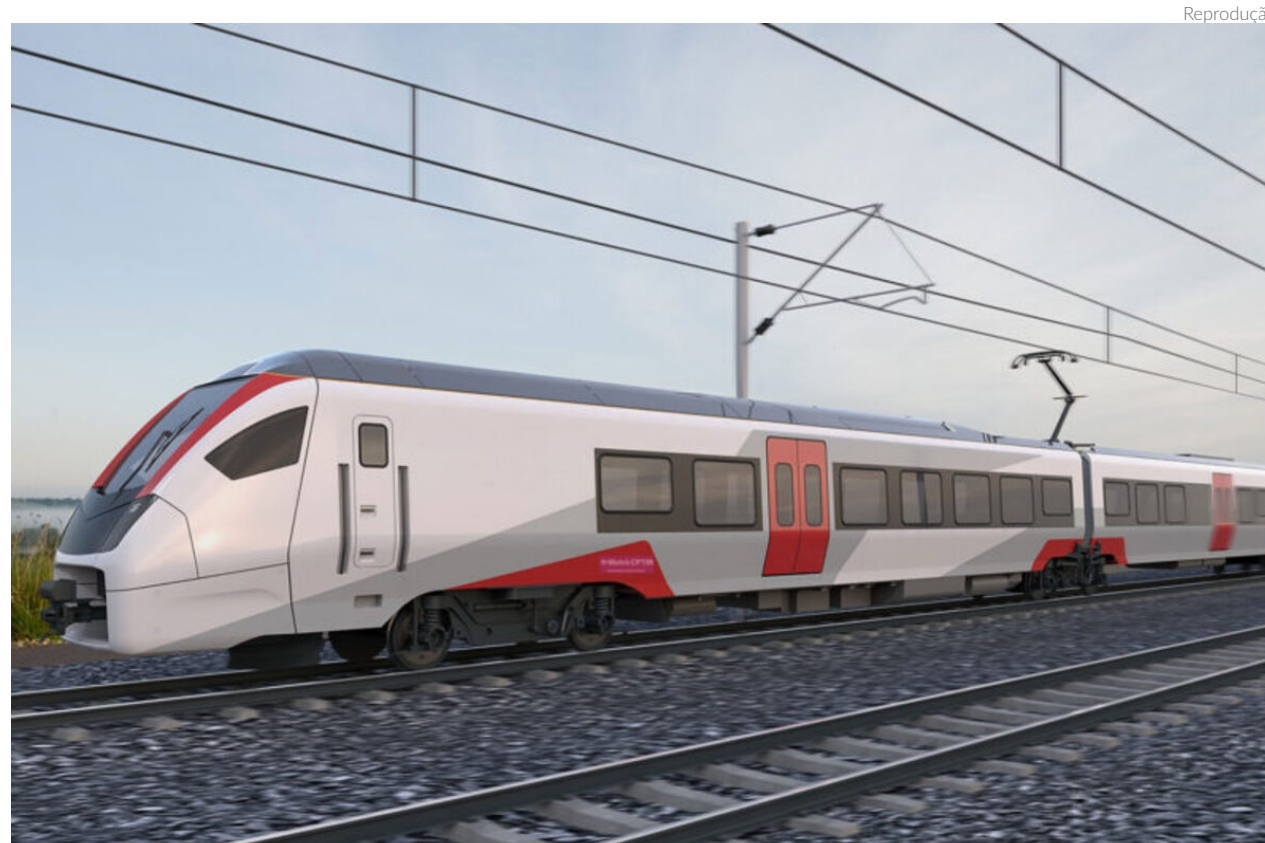
A ligação São Paulo-Campinas terá cerca de 100 quilômetros de trajeto, oferecendo um serviço expresso entre a Estação Barra Funda e Campinas, com parada em Jundiaí

A concessão do Trem Intercidades Eixo Norte engloba três serviços: a Linha 7-Rubi, o Trem