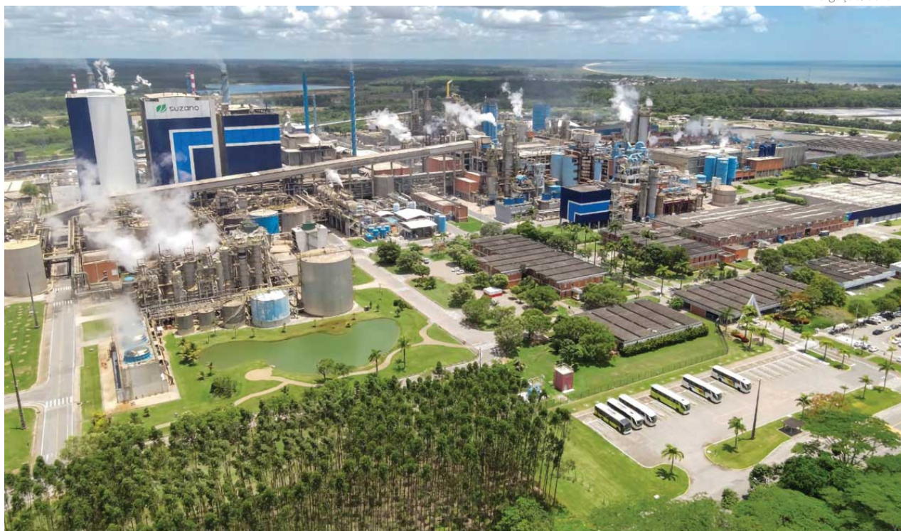
A nova fábrica da Suzano, na cidade de Ribas do Rio Pardo (MS), já está perto de ser concluída, com início das operações previsto para o segundo semestre deste ano

Com uma política de priorização da qualidade de suas operações, administra terminais no Porto de Santos (SP) - em parceria com a DP World -, no Porto do Itaqui (MA) e em Aracruz (ES), além de instalações marítimas na Bahia. Além disso, a nova fábrica da empresa, em Ribas do Rio Pardo (MS), já está