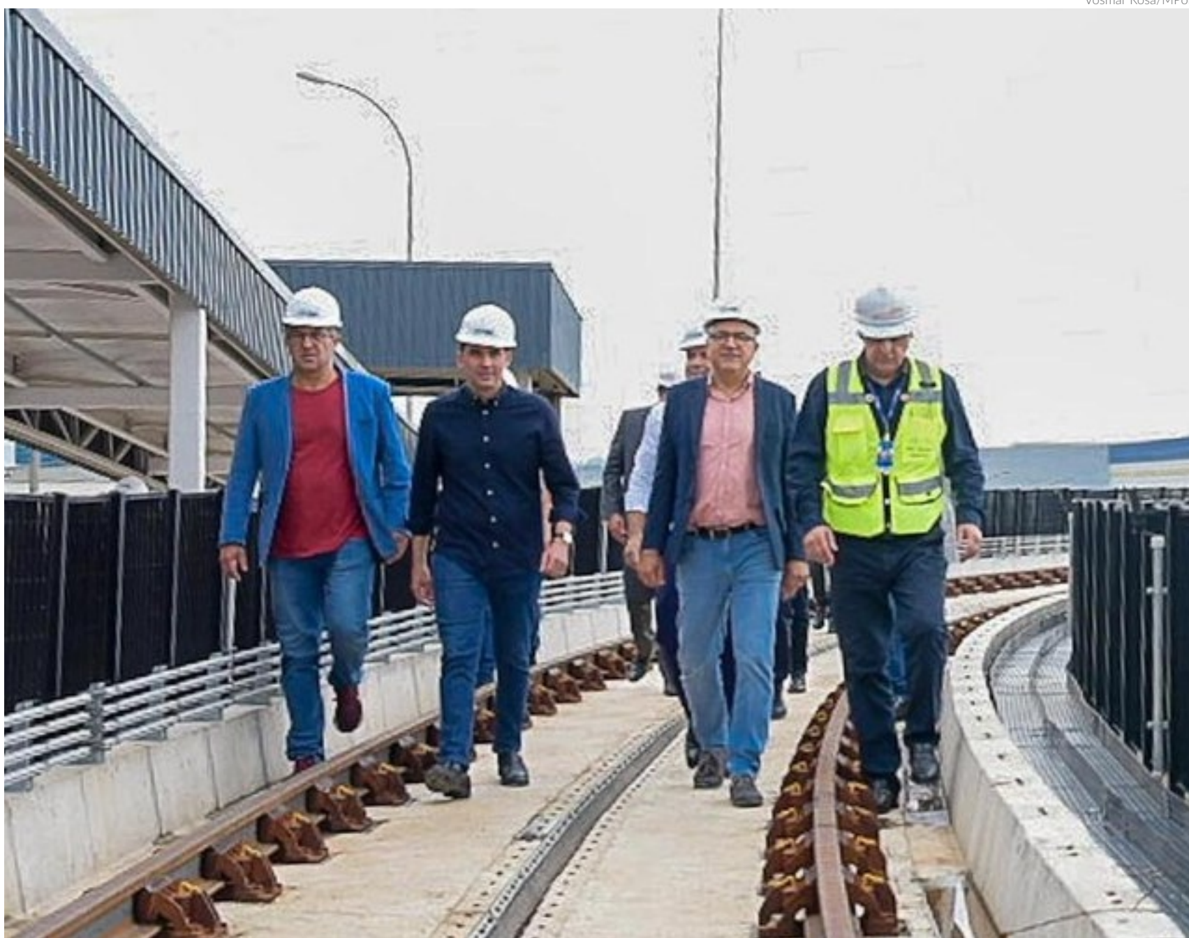
Os ministros Silvio Costa Filho (Portos e Aeroportos), Alexandre Padilha (Relações Institucionais) e Renan Filho (Transportes) fizeram a visita para acompanhar as obras