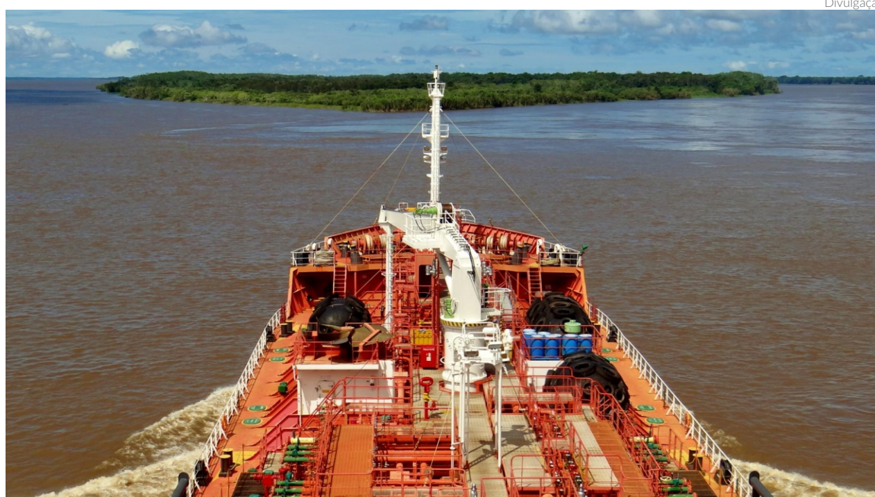
O estudo foi concluído em 2023 e visa a concessão da região para alavancar a infraestrutura de acesso hidroviário e promover uma navegação mais segura e eficiente