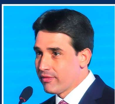
Silvio Costa Filho Ministro de Portos e Aeroportos