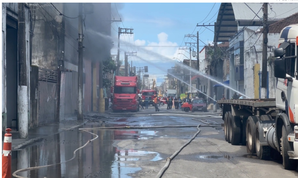
Os bombeiros trabalham em três linhas de frente, visando conter o fogo que deu origem ao incêndio, e também evitar que novos focos de incêndio ocorressem dentro do galpão

Segundo o Corpo de Bombeiros, o depósito pertence à empresa Dínamo Inter-Agrícola, mas era utilizado pela Recei-