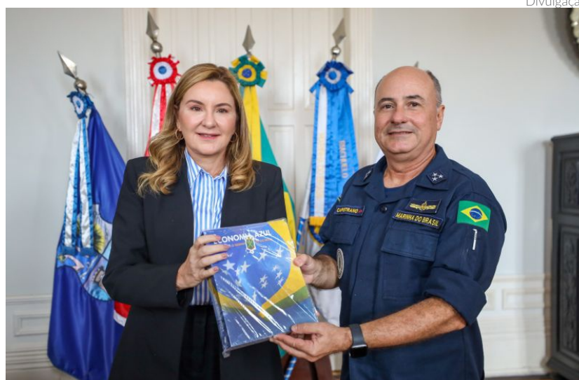
O encontro foi realizado entre a vice-governadora do estado, Hana Ghassan, e o vice-almirante Antônio Capistrano, comandante do 4º Distrito Naval

“Um dos projetos que o Governo do Estado, junto com o Governo Federal, está trabalhando é a dragagem do canal na frente do Porto de Belém para que possamos receber os grandes cruzeiros e utilizá-los como hospedagem. Sendo assim, diante do seu papel fundamental, a Marinha vai homologar as obras de calado do Porto de Belém, por isso é tão