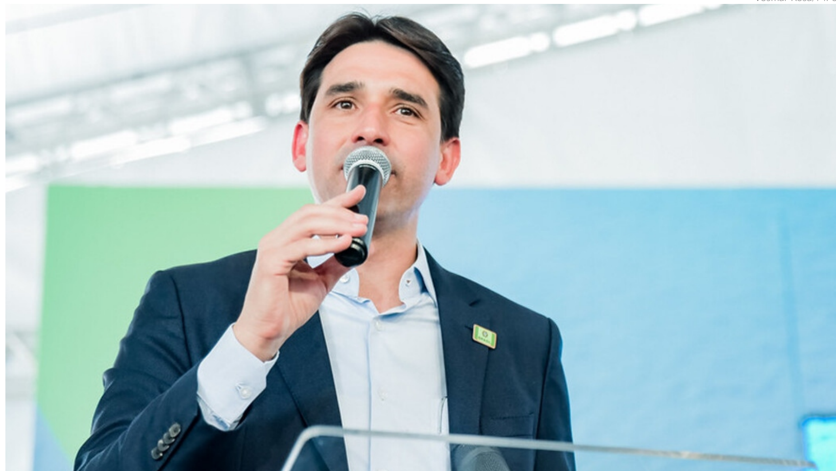
Ministro fará anúncios importantes de planejamento e investimentos para o Porto de Santos e além disso, vai realizar uma vistoria das obras do Aeroporto de Guarujá

CÁSSIO LYRA cassio.lyra@redeneews.com.br