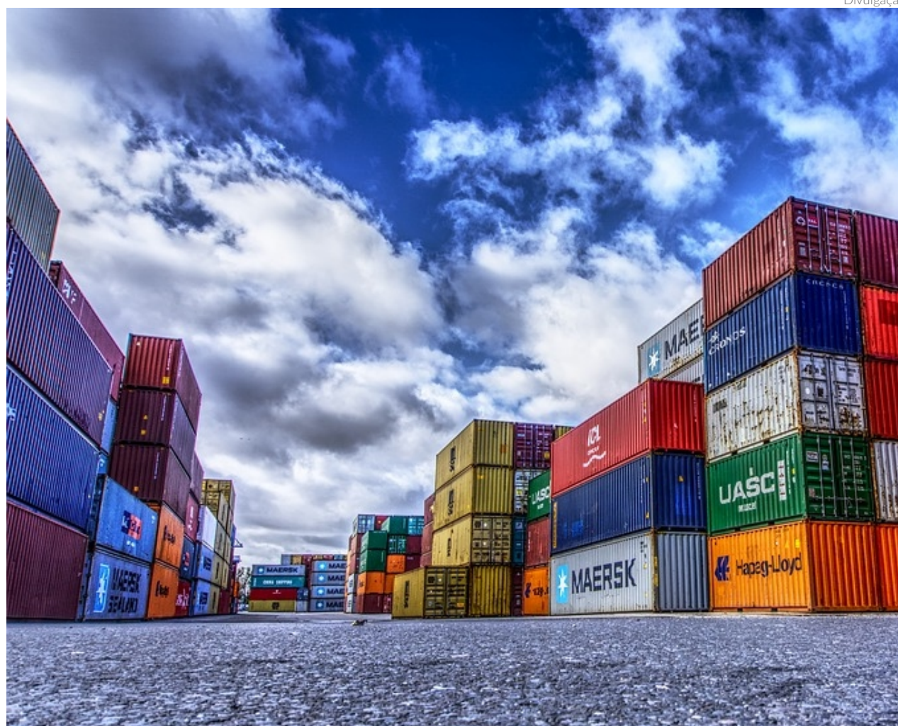
O novo empreendimento será dedicado à movimentação de cargas gerais, composto de armazéns cobertos para cargas e pátio para contêineres.

A nova área está estrategicamente situada na margem direita do cais de Santos, no bairro Valongo, a cerca de 5 km de distância do terminal atual. Com uma área total de 90 mil m 2 , o novo terminal promete oferecer melhor acessibilidade aos veículos de carga, reduzindo os tempos de operação den-