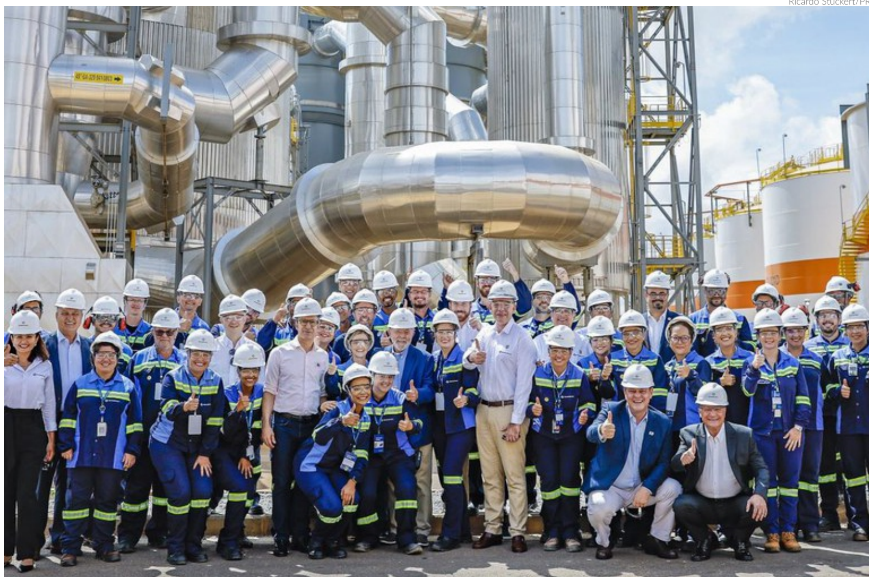
Presidente Lula posa para foto com funcionários; segundo ele, o Brasil caminha para reduzir a dependência de importação de fertilizantes e para se tornar o "celeiro do mundo"

Segundo o Governo, o complexo tem como previsão fornecer 1 milhão de toneladas de fertilizantes fosfatados por ano para a agricultura brasileira, re-