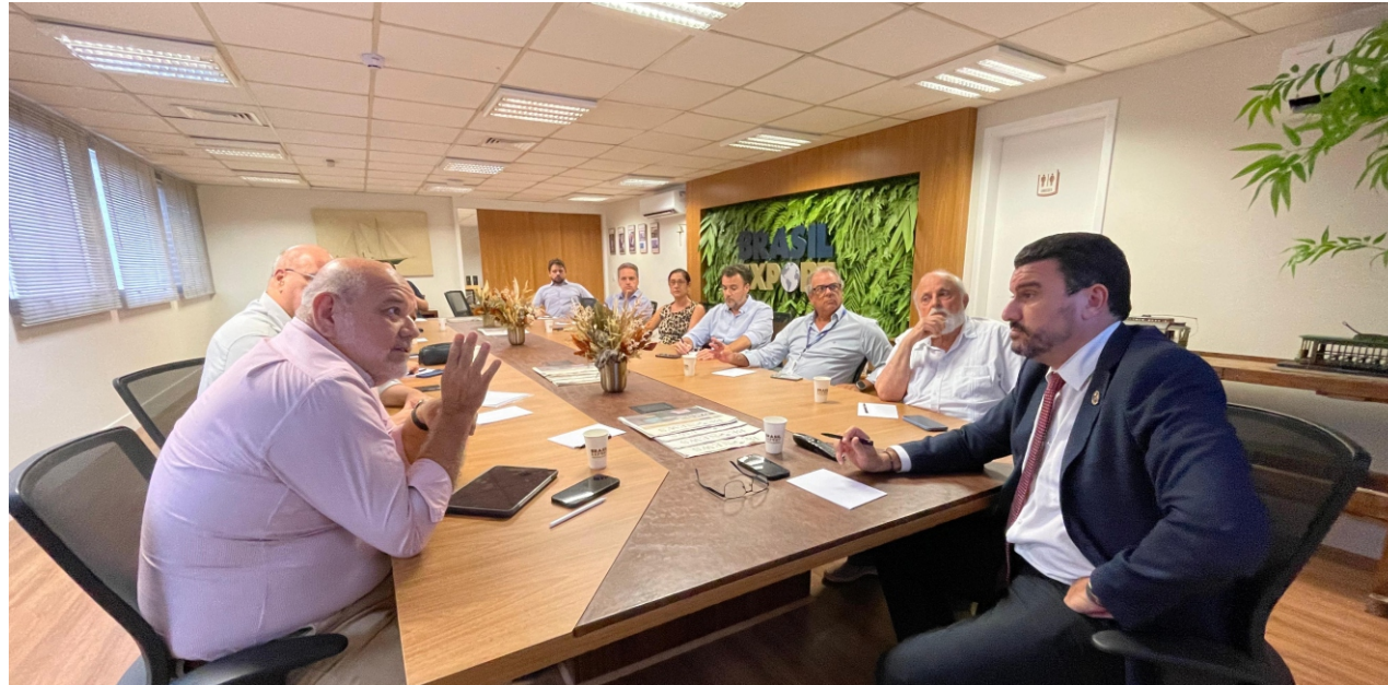
▲ Durante a reunião do Conselho do Santos Export foram discutidos os temas do fórum regional. O próximo passo será definir os participantes dos painéis dentro do evento

Segundo o presidente do Conselho do Santos Export, e diretor-executivo do Sindicato dos Operadores do Estado de