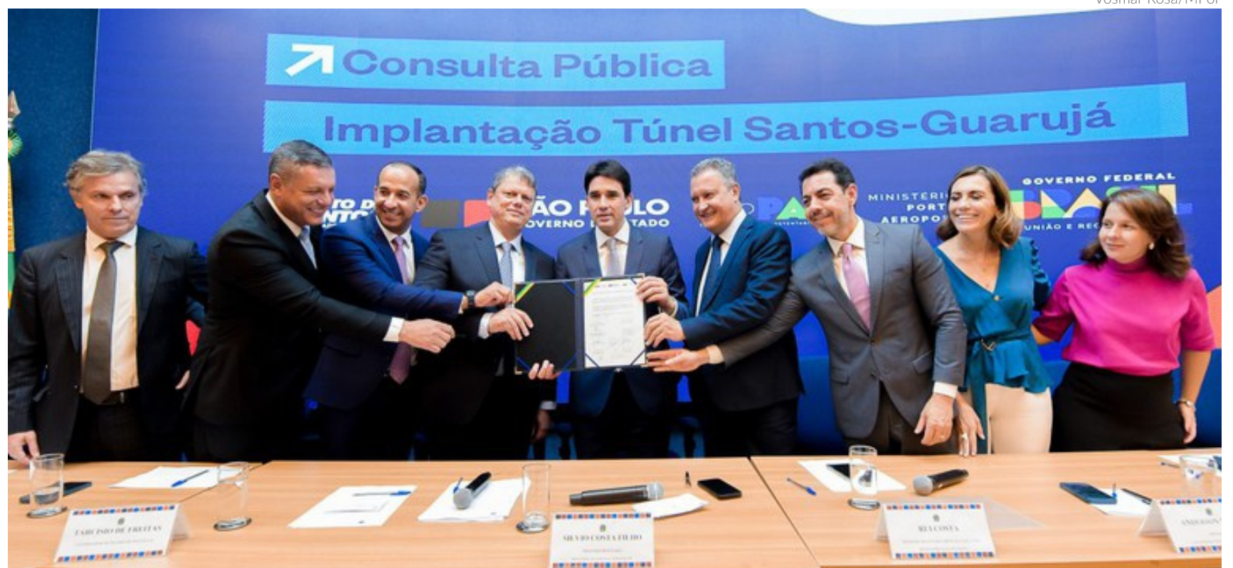
A cerimônia de lançamento da consulta pública do túnel Santos-Guarujá, em Brasília, reuniu ministros, o governador de São Paulo e demais autoridades federais e estaduais

Edital vai estar disponível por 45 dias na plataforma do Governo Federal. Governador de São Paulo quer leiloar a obra até o início de 2025