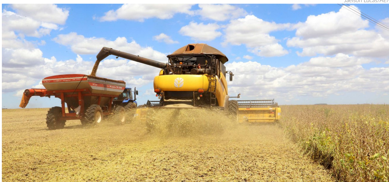
Em relação à soja, 5,4 milhões de toneladas resultam da diferença nas estimativas para os estados e 4,2 milhões referem-se às diferenças na produtividade estimada de área plantada

Os dados são resultado do uso de imagens de satélite complementado pelos levantamentos com a rede de contatos da Agroconsult, acompanhamento do mercado de insumos e análise de campo. Com a implantação de uma ferramenta