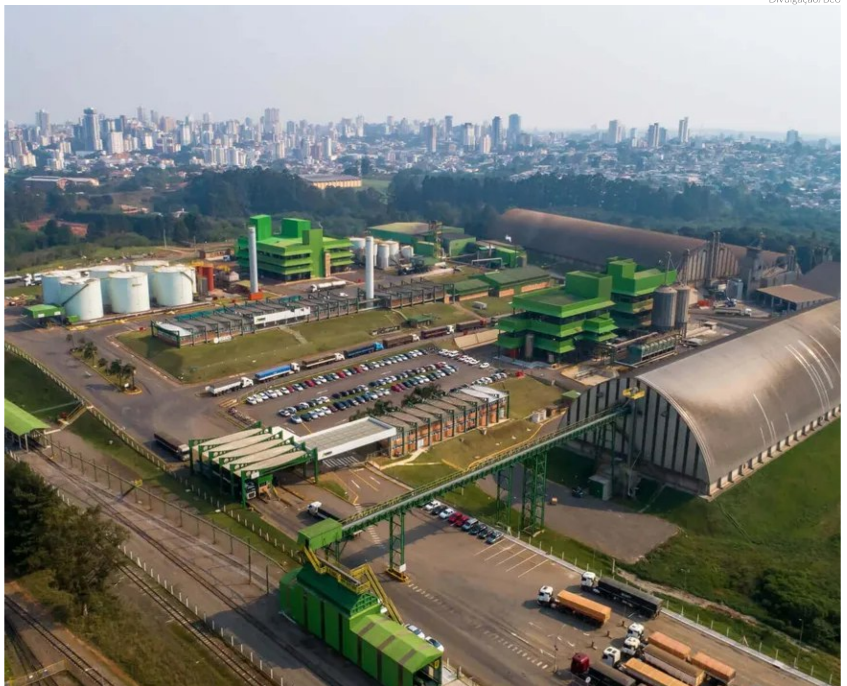
Unidade da Be8 em Passo Fundo (RS): a empresa pretende criar cerca de 220 empregos diretos após a conclusão da obra e outros 700 durante a fase de implantação do projeto

Da Redação redacao.jornal@portalbenews.com.br