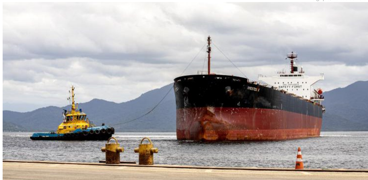
Segundo a Portos do Paraná, no ano passado um total de 13 agências marítimas optou pela cabotagem para o transporte de cargas nos complexos de Paranaguá e Antonina

“A cabotagem é alternativa logística para a redução dos custos de transporte e para desafogar o modal rodoviário. Por isso nós buscamos incentivar a cabotagem nos portos de Paranaguá e Antonina, aplicando taxas com até 50% de desconto