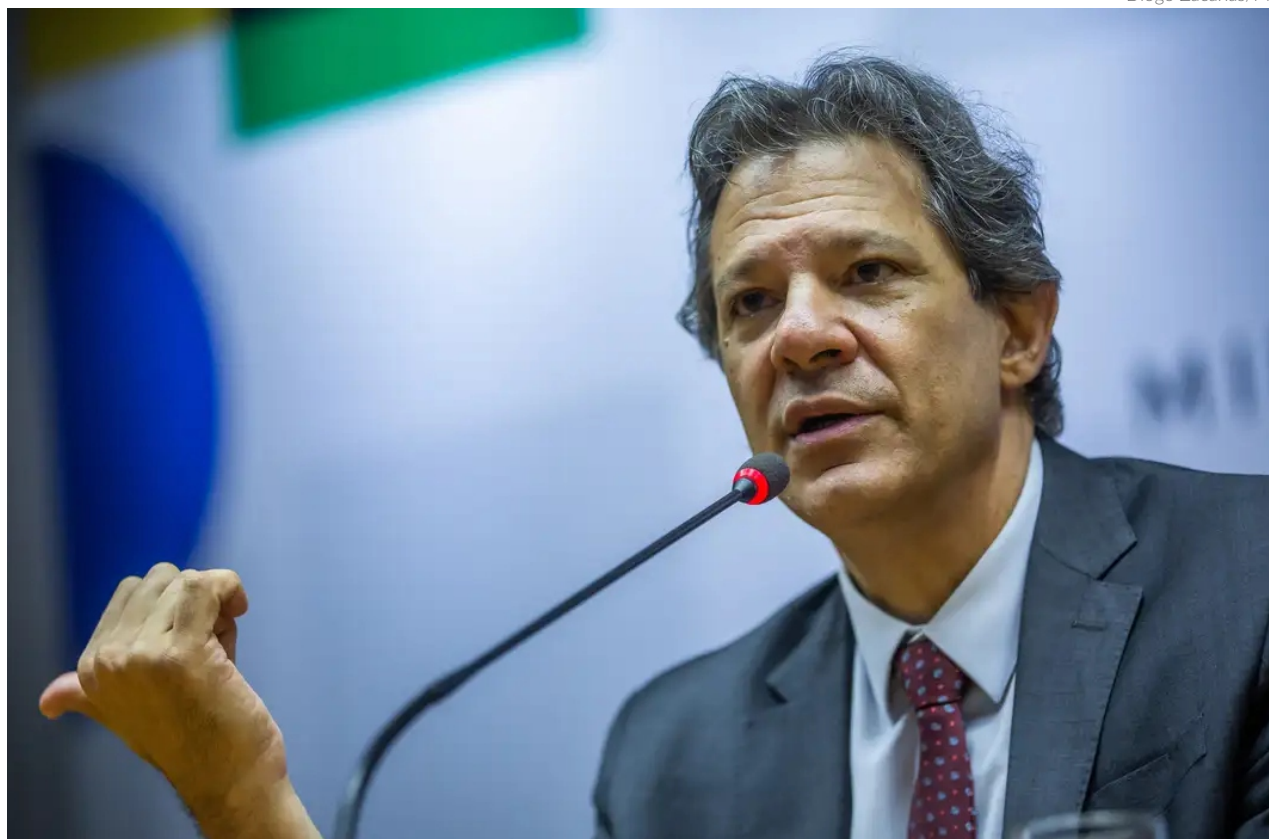
O ministro da Fazenda, Fernando Haddad, afirmou que não discutiu na reunião com Lula se o atual presidente da Petrobras, Jean Paul Prates, fica ou não no comando da estatal

“Quem tem que decidir é a petrobras, já está bem encaminhado isso, a gente tem levado