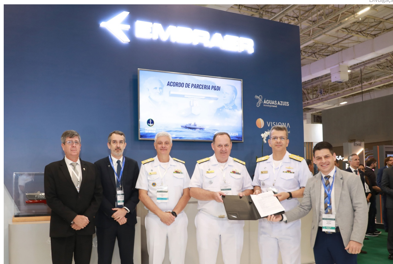
A cooperação contribui para ampliar tanto o alto conteúdo tecnológico dos Programas Estratégicos da Marinha quanto o desenvolvimento da Base Industrial de Defesa

Brasil e da Embraer abrangem a integração do Radar Gaivota X com o Sistema de Comando e