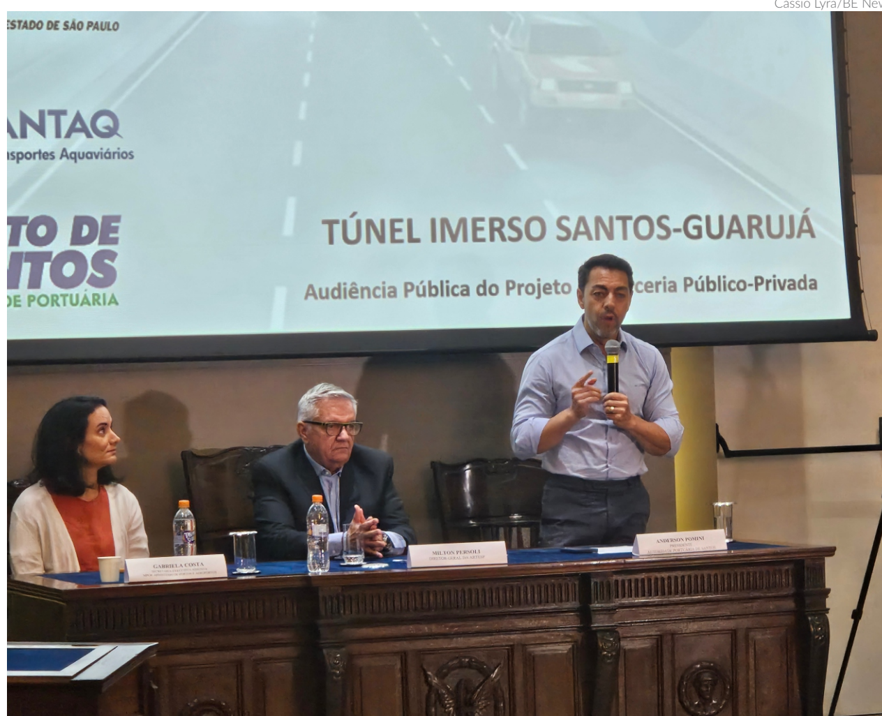
A audiência pública tratou da dinâmica da realização das obras do túnel, preço tarifário, a modelagem jurídica e financeira, canteiro de obras e criação de docas secas

“Toda contribuição que recebemos será anotada e trazida para o projeto. Nós temos um grupo de análise que vai