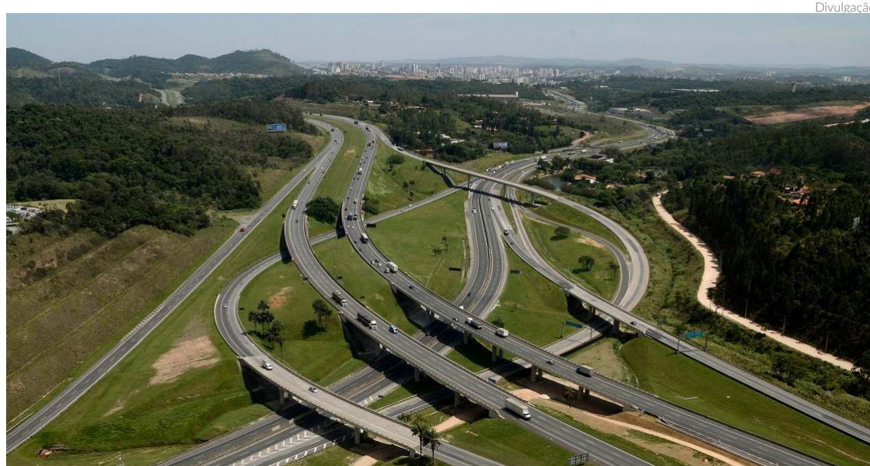
Com a autorização da Receita, o Terminal de Carga de Viracopos pode realizar todas as transferências de carga internacional que também chegarem via marítima ou terrestre

O projeto prevê a intervenção no pavimento em aproximadamente 2,1 mil quilômetros de faixas de rolamento e acostamento das rodovias, nos trechos que vão da capital paulista ao município de Cordeirópolis