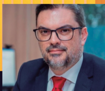
Fabrizio Pierdomênico Economista e ex-secretário nacional de Portos e Transportes Aquaviários