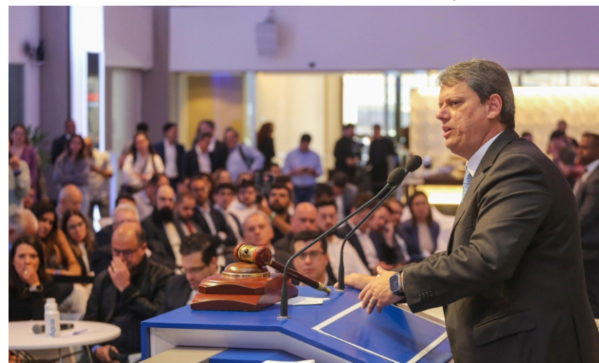
Durante o leilão de concessão rodoviária do Lote Litoral Paulista, o governador Tarcísio de Freitas disse que é possível a realização do certame do túnel ainda este ano

“Nós defendemos que essa obra tem natureza mista, ou seja, infrarodoviária. Essa obra não poderia ser levada em