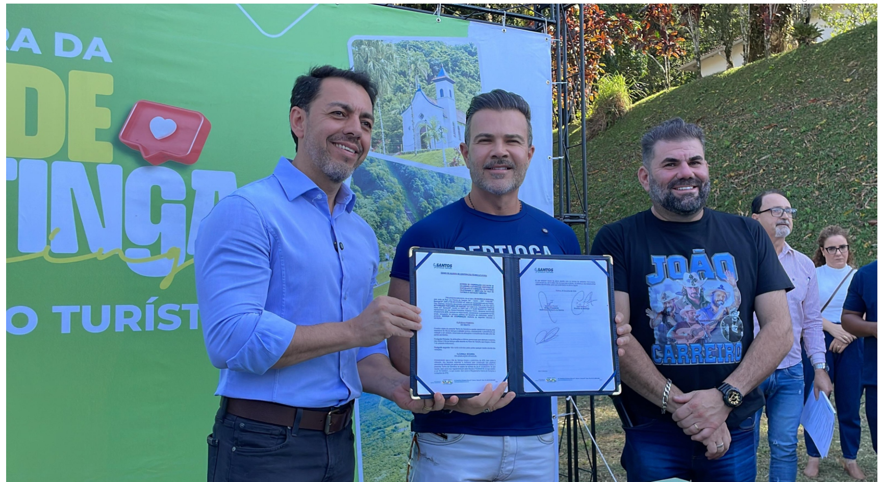
Na solenidade realizada na segunda-feira, dia 24, na Vila de Itatinga foi assinado um termo de cooperação técnica entre a Autoridade Portuária de Santos e a Prefeitura de Bertioga

ma de PPP, uma das premissas para a empresa vencedora é a exploração e adequação dessa área da Vila de Itatinga para o bom turismo. Temos aqui 70 casas construídas do formato inglês, trilhas riquíssimas já conhecidas por moradores, e agora passarão a ser conhecidas por turistas. Essa integração entre porto e cidade é o que buscamos”, comentou.