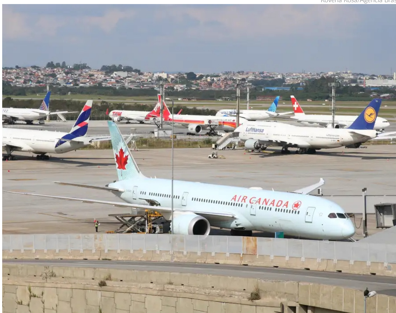
Nos últimos meses o Ministério de Portos e Aeroportos anunciou o aumento da malha aérea para o exterior e a retomada de rotas descontinuadas no período da pandemia

Entre os voos anunciados está o incremento de 95 novas operações semanais de Por-