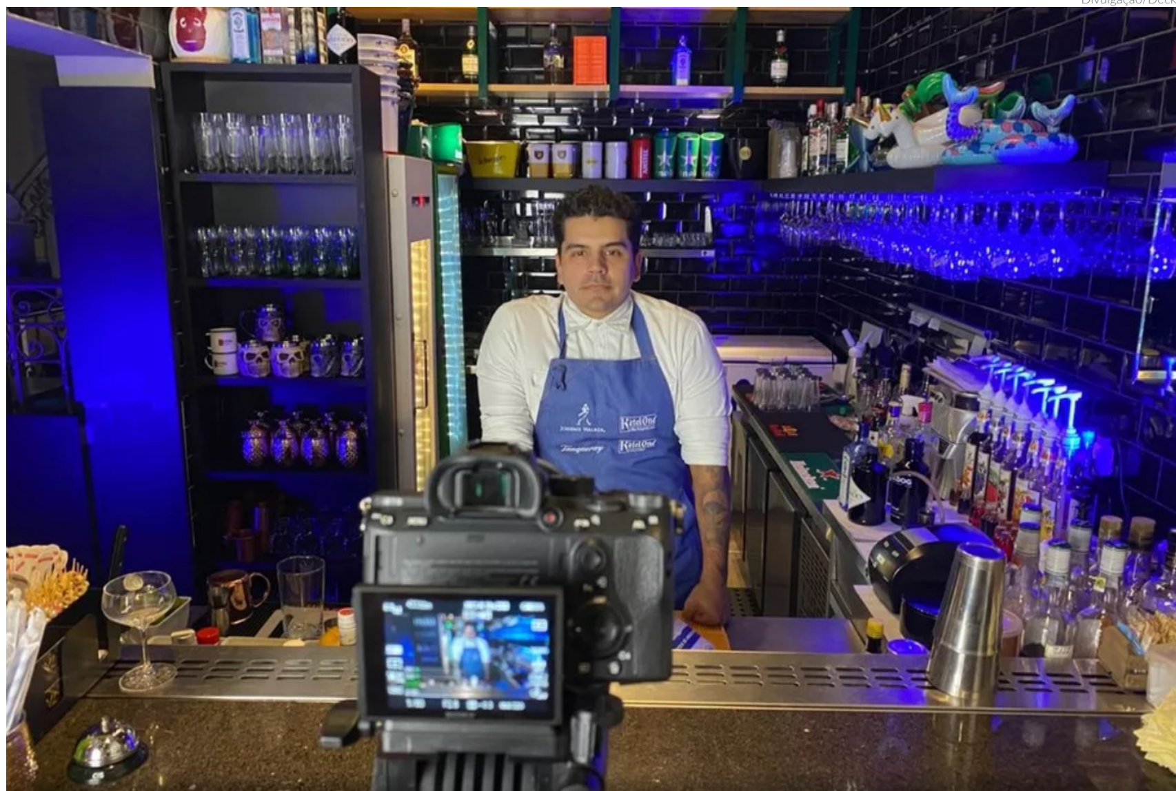
Os alunos serão qualificados nas principais especialidades de tripulante de navios de cruzeiro, com aulas ministradas por professores diretores, gerentes e supervisores

Os candidatos precisam ser brasileiros, residir no Brasil, ter entre 18 e 45 anos; estar cursando ou ter concluído o Ensino Médio e ter o sonho de mudar de vida por meio do tra-