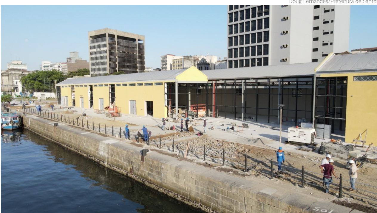
Com a entrega da primeira fase do projeto, a área do antigo Armazém 4 será totalmente revitalizada, com estrutura coberta, climatizada, que servirá para a realização de eventos

Tudo isso é fruto do planejamento urbano sério e integrado, que pensa a Cidade como um todo e traz desenvolvimento sustentável. Essa é a Santos que queremos”, afirma o prefeito Rogério Santos (Republicanos).