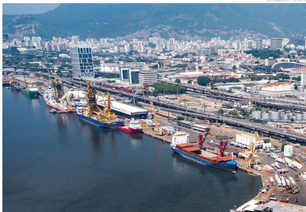
De acordo com o Relatório de Execução Orçamentária das Empresas Estatais, contando todas as estatais federais, a PortosRio ficou com a quinta melhor taxa de execução

O Relatório de Execução Orçamentária das Empresas Estatais foi divulgado na última semana pela Secretaria de Coordenação e Governança das Empresas Estatais do Ministério da Gestão e Inovação em Serviços Públicos (SEST/MGI). A execução orçamentária refere-se a utilização dos créditos consignados no Orçamento Geral da União, visando à realização