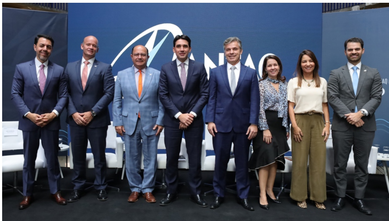
Os dados foram apresentados durante a cerimônia promovida pela Antaq, que contou com a presença do ministro de Portos e Aeroportos, Silvio Costa Filho, e outras autoridades

vulgados, o aumento do setor foi impulsionado principalmente por cargas containerizadas e pelo crescimento no transporte de grãos sólidos e líquidos. De janeiro a junho deste ano, as cargas containerizadas apresentaram recorde para o período, atingindo movimentação de 73,3 milhões de toneladas. O resultado representa aumento de 22,72% em comparação com o mesmo período do ano passado.