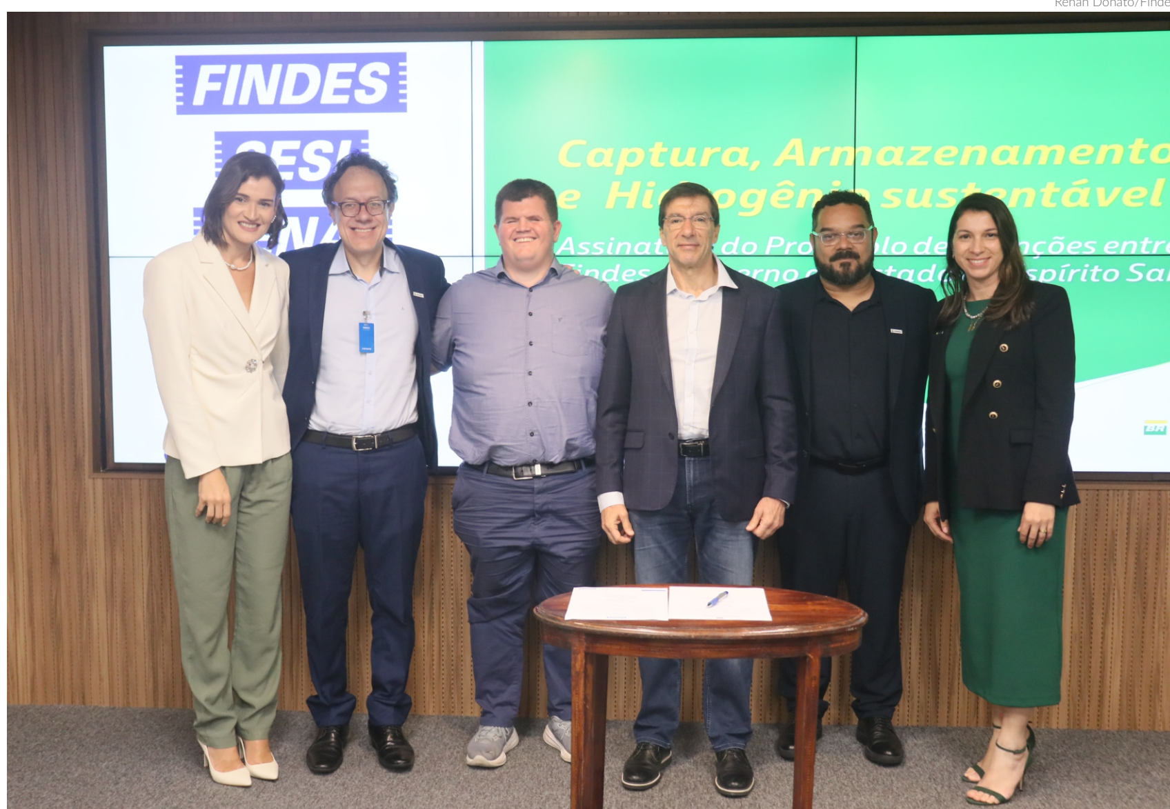
Representantes da Petrobras, do Governo Estadual e da Federação das Indústrias do Espírito Santo participaram da cerimônia de assinatura do protocolo de intenções

CÁSSIO LYRA cassio.lyra@redenebnews.com.br