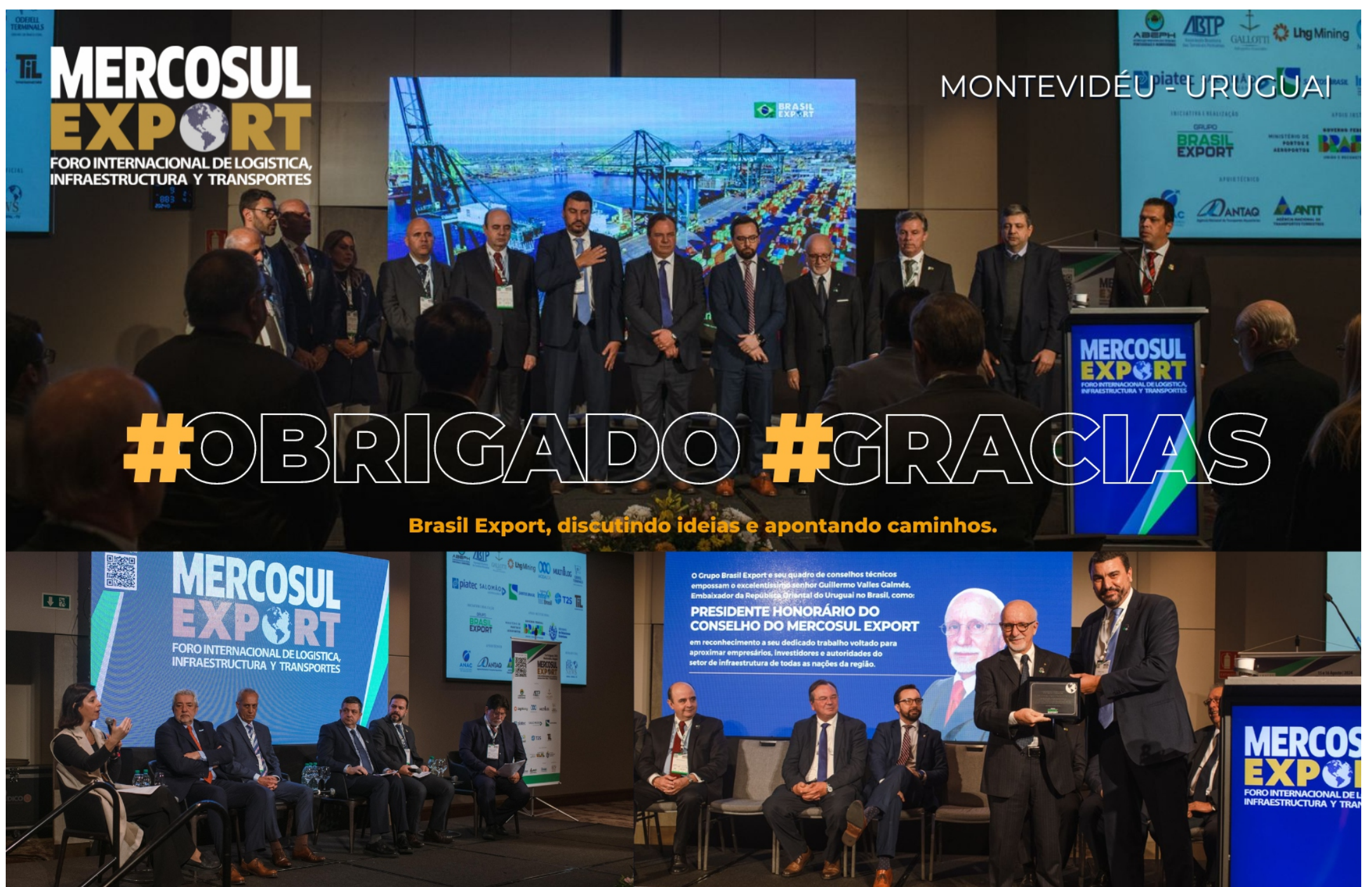
Brasil Export, discutindo ideias e apontando caminhos.

Mais informações sobre como participar dos leilões estão disponíveis no site da Receita Federal: https://www.gov.br/receitafederal/pt-br/assuntos/leilao