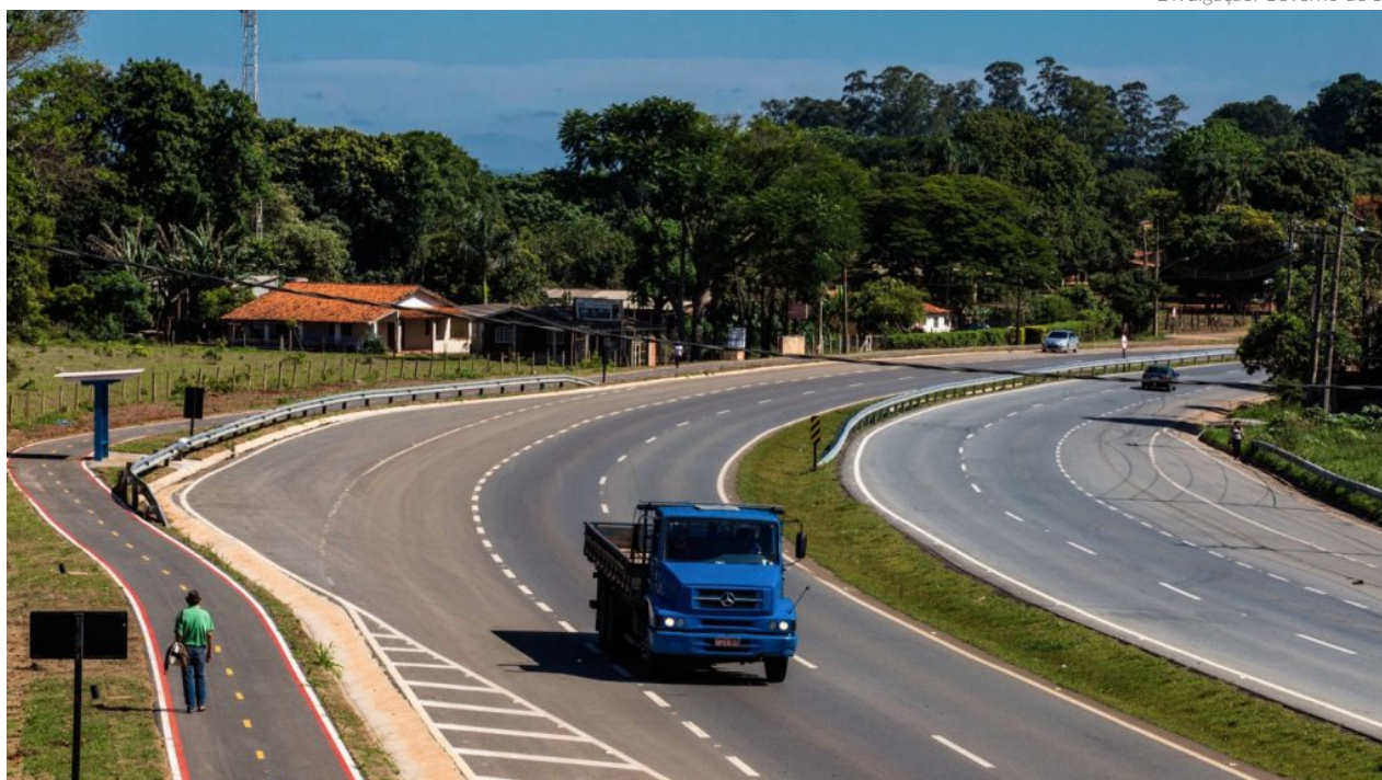
De acordo com o Governo de São Paulo, na Rota Sorocabana, a queda nas tarifas em cinco praças vai variar entre 21,5% e 22,6%, o que representa uma redução de R$ 1,13 a R$ 3,40

Com o fim do contrato da ViaOeste, o poder público reduzirá os valores nas oito praças de pedágio mencionadas. Itu, Soro-