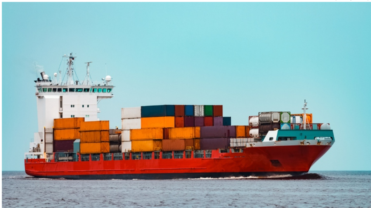
▲ Sendo uma relação bilateral, o Brasil também importou produtos do país asiático, como produtos florestais e têxteis. As importações somam aproximadamente US$ 1,18 bilhão

de Comércio e Relações Internacionais do Mapa (SCRI), entre agosto de 2023 e julho de 2024, a China foi o principal destino das exportações brasileiras do agronegócio, totalizando US$58,60 bilhões (aproximadamente R$286,38 bilhões). Houve um aumento de 10% em comparação ao período anterior. Em 2023, as exportações para a China atingiram um recorde de mais de US$ 60 bilhões (cerca de R$ 293,40 bilhões), um crescimento de mais de US$ 9 bilhões (R$ 44,01 bilhões) em