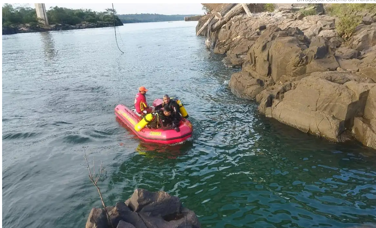
As buscas pelas vítimas do desabamento da ponte Juscelino Kubitschek prosseguem, mas enfrentam desafios devido às chuvas, que tornam as águas do rio Tocantins mais turvas

Da Redação redacao.jornal@redebeneews.com.br