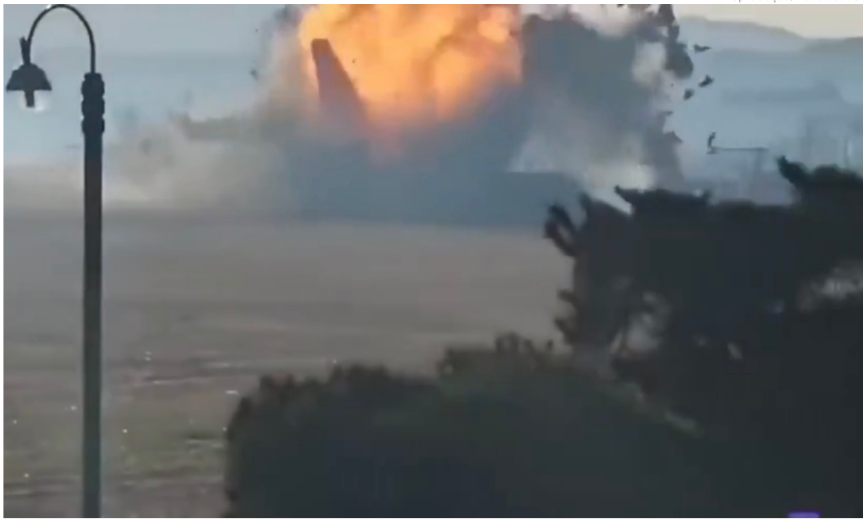
Durante o pouso, o avião da Jeju Air tocou o solo do Aeroporto Internacional de Muan, mas saiu da pista em alta velocidade e colidiu contra um muro, resultando em uma explosão

Da Redação redacao.jornal@redebeneews.com.br