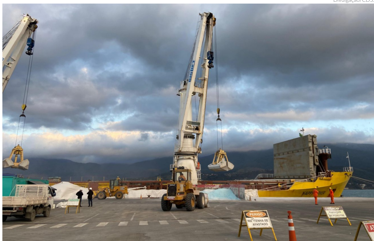
Segundo a CDSS, o desenvolvimento das operações do porto decorre de melhorias implantadas que têm garantido mais agilidade para o transporte internacional de cargas

De acordo com a CDSS, entre as principais cargas transportadas estão o açúcar, barilha (matéria-prima essencial na produção de vidros e embalagens) e o coque de petróleo,