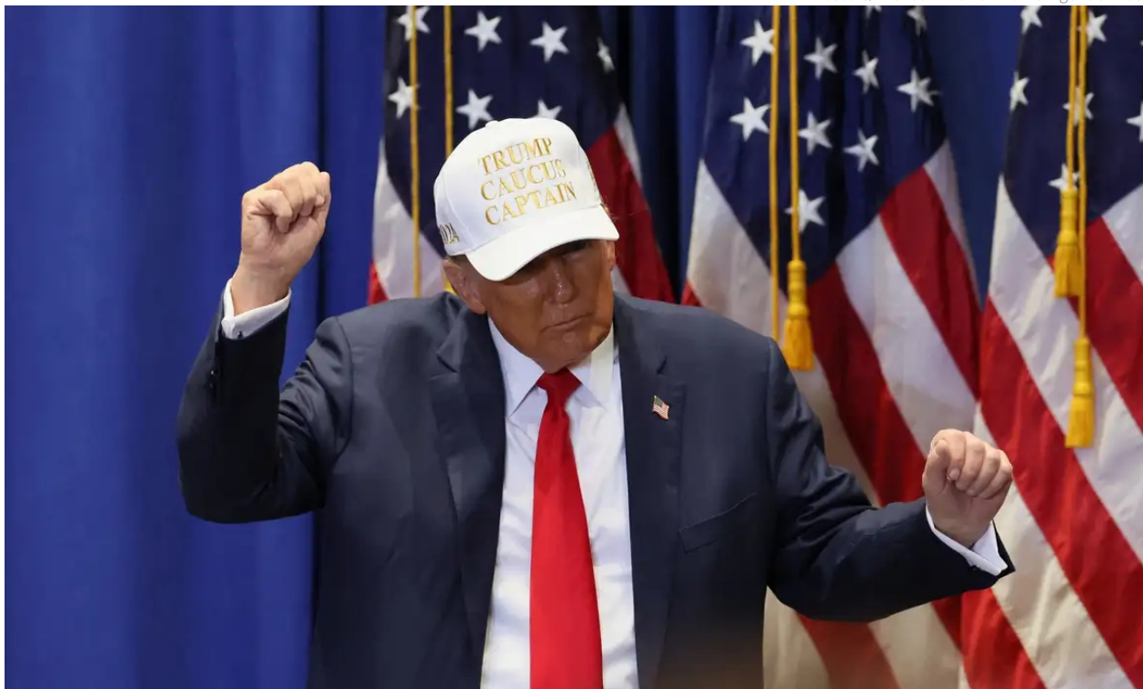
O presidente eleito também mencionou a possibilidade de renomear o Golfo do México para "Golfo da América", em um esforço para refletir a importância dos Estados Unidos na região

Ele criticou a China pela administração do canal, afirmando que os norte-americanos come-