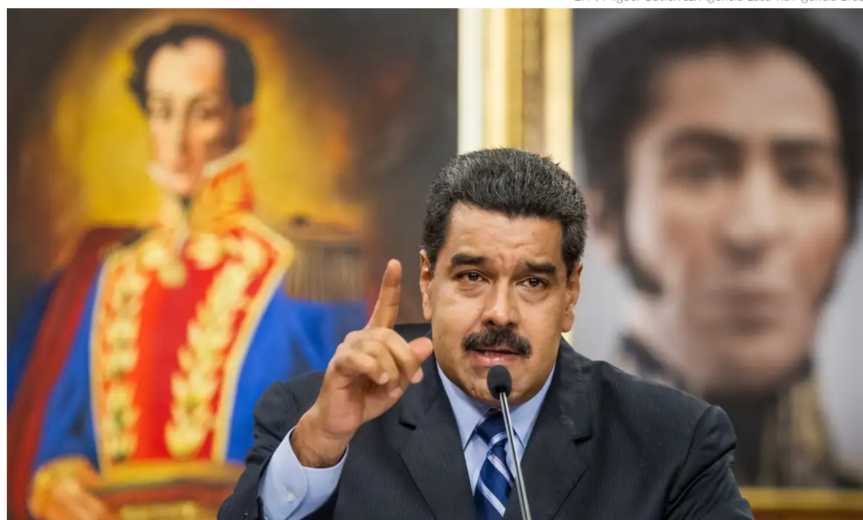
A crise diplomática com o Paraguai ocorre poucos dias antes da posse do presidente venezuelano Nicolás Maduro para seu terceiro mandato, marcada para sexta-feira, dia 10

A Venezuela criticou a postura do Paraguai e reiterou que a intervenção externa violaria o princípio da autodeterminação dos povos. Caracas ainda defen-