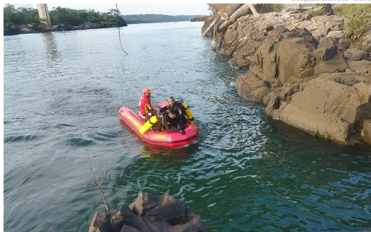
A suspensão das buscas ocorreu devido à abertura das comportas da Usina Hidrelétrica de Estreito, necessária para liberar o excesso de água acumulado pelas chuvas na região

De acordo com a Marinha, as operações se concentraram nas áreas mais prováveis de localização das vítimas, próximas a veículos e escombros no fundo do Rio Tocantins. Uma segunda fase, iniciada no domingo, dia 5, ampliou as buscas para regiões adjacentes. "Essa