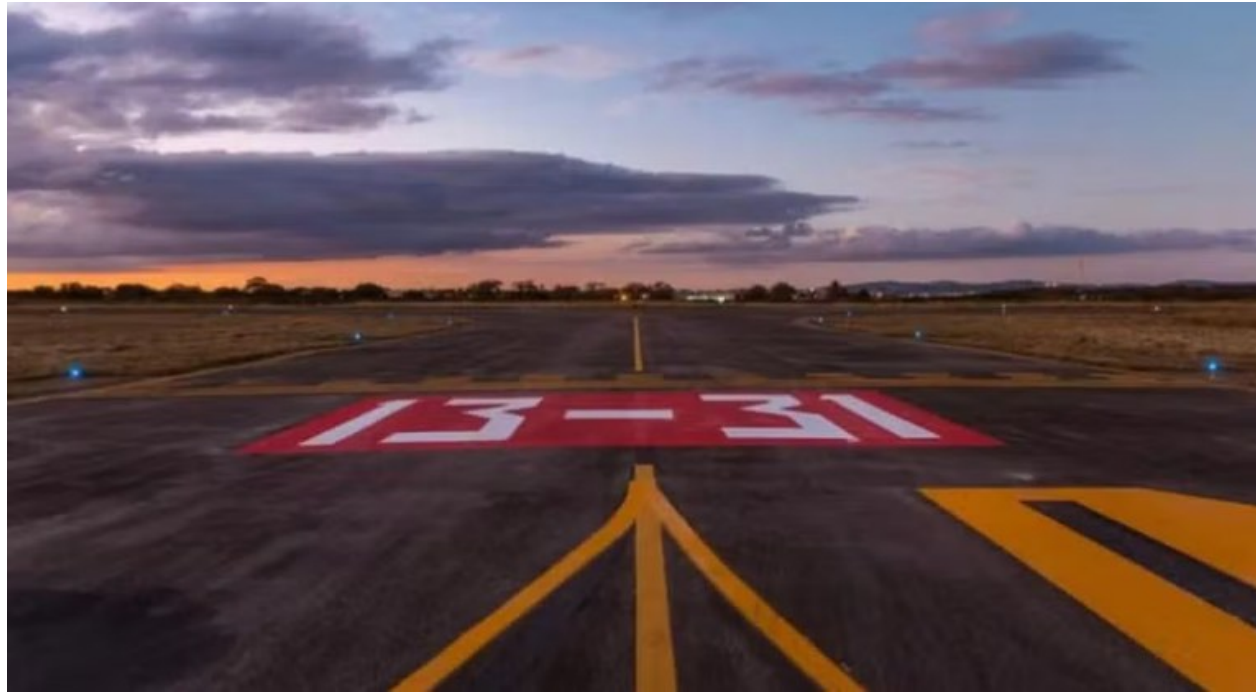
Entre as melhorias planejadas estão a construção de um novo terminal de passageiros, com 6 mil m², e a ampliação da pista de pouso e decolagem, que passará de 1.800 para 2.250 m

Para o ministro Silvio Costa Filho, "a aplicação de investimentos em aeroportos regionais evidencia o compromisso do Governo Federal em melhorar a