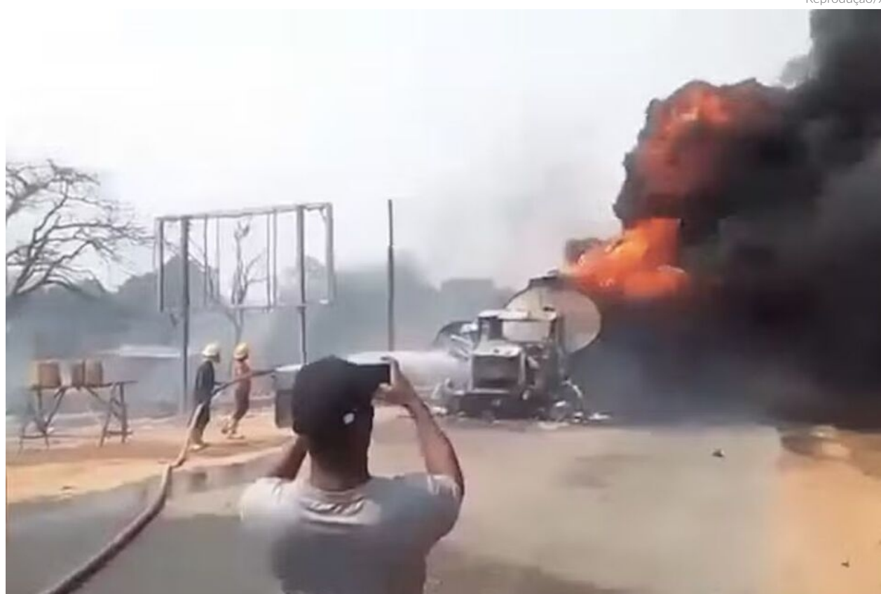
◀ O caminhão-tanque estava carregado com 60 mil litros de gasolina, capotou e explodiu

Ao menos 86 pessoas morreram e outras ficaram feridas após um caminhão-tanque carregado com 60 mil litros de gasolina capotar e explodir, segundo informações dos Corpos de Segurança das Estradas Federais.