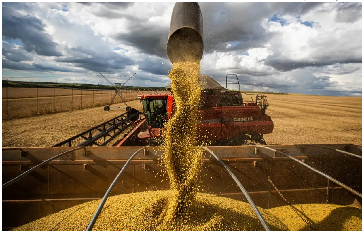
▲ Goiás é o quarto maior produtor nacional de grãos, com participação de 10,5% dos produtos agrícolas do país